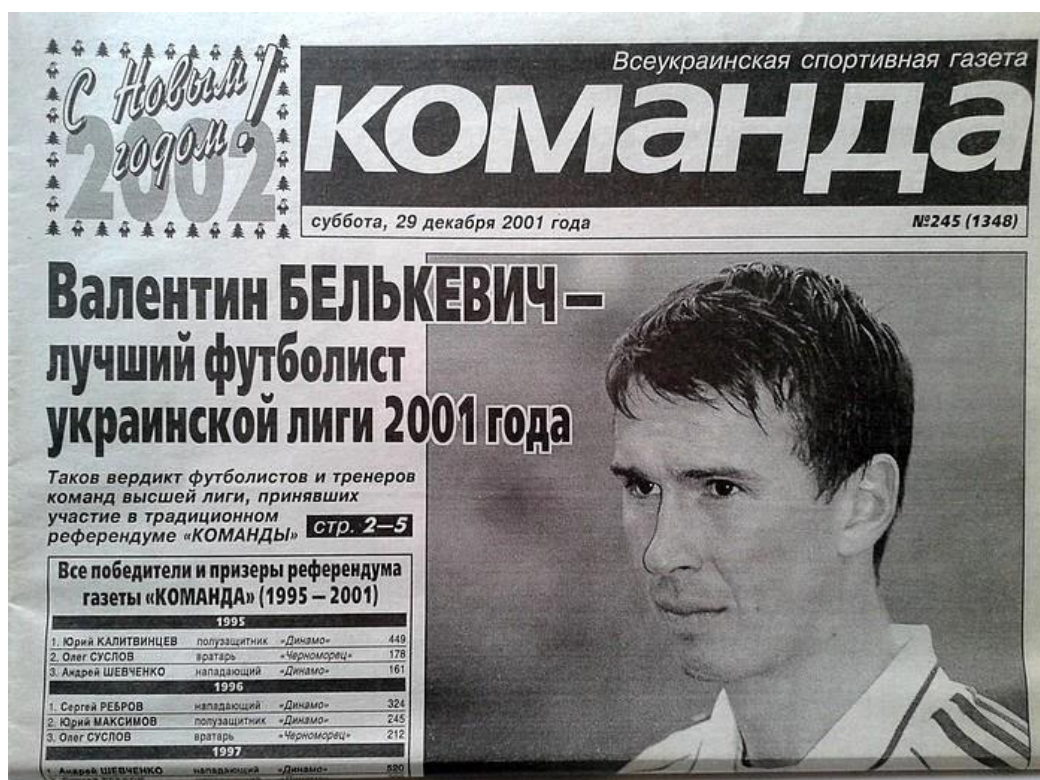
Рисунок 2.6 - Газета «Команда» [24]

«Команда» формувалася як медіапроект, покликаний скласти конкуренцію транснаціональному виданню «Спорт-Експрес в Україні» (репрезентанту російського холдингу ЗАТ «Спорт-Експрес»), що висвітлює змагання в планетарному масштабі, але відрізняється адаптованістю тематики та проблематики для української аудиторії.