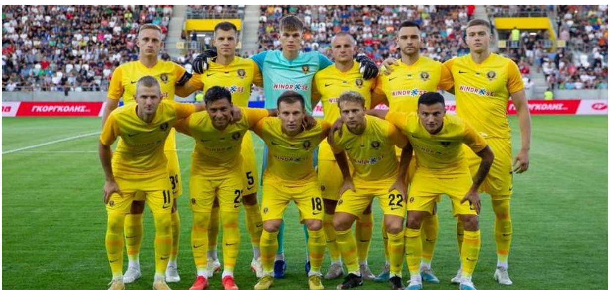
Рисунок 2.3 - Футбольний клуб "Дніпро-1" [15]

У матеріалах журналістів простежується акцент на тому, що "Дніпро-1" прагне продовжувати спадщину свого попередника, залишаючи сильний вплив на вболівальників та футбол в Україні загалом.