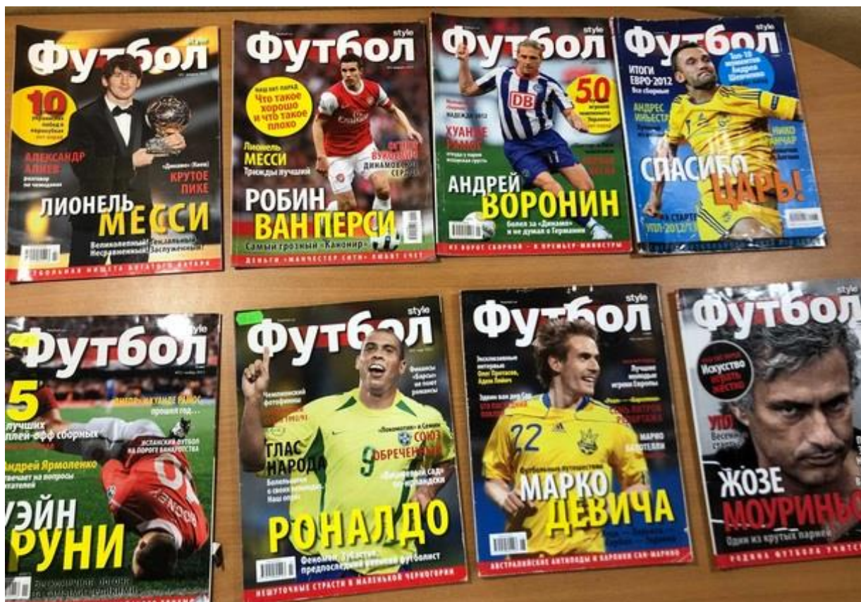
Рисунок 2.7 - Журнал «Футбол Style» [26]