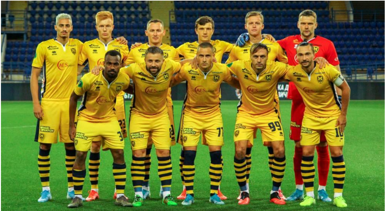
Рисунок 2.4 - Футбольний клуб "Металіст" Харків [18]

Також важливим аспектом висвітлення є історії про відновлення "Металіста", які подаються як приклад стійкості та віри у краще майбутнє. Журналісти аналізують трансферну політику клубу, його сучасні досягнення та роль у розвитку регіонального футболу, роблячи акцент на тому, що "Металіст" є не лише спортивним, а й культурним брендом Харкова.