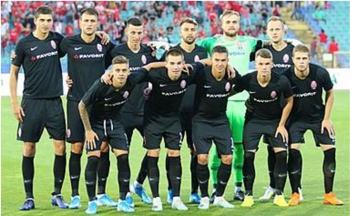
Рисунок 2.5 - Футбольний клуб "Зоря" Луганськ [20]

Журналісти висвітлюють футбольний клуб "Зоря" як символ стійкості та мужності. Особливу увагу привертають тренерські стратегії Віктора Скрипника, які стали важливим фактором успіхів клубу. Медіа також роблять акцент на підтримці команди з боку громади, що підкреслює соціальну значимість футболу в Україні [21].