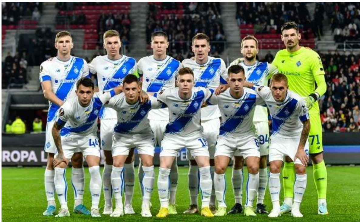
Рисунок 2.1 – футбольна команда "Динамо" Київ [10]

Окрім досягнень, журналісти також висвітлюють кризові моменти в історії клубу, такі як внутрішні конфлікти, складнощі зі зміною тренерів, економічні труднощі та трансферні суперечки. Часто піднімається тема впливу політики на функціонування клубу, а також його роль у формуванні національної ідентичності. "Динамо" асоціюють із символом Києва та всієї країни, що додає клубу особливого статусу [11, с. 102-118].