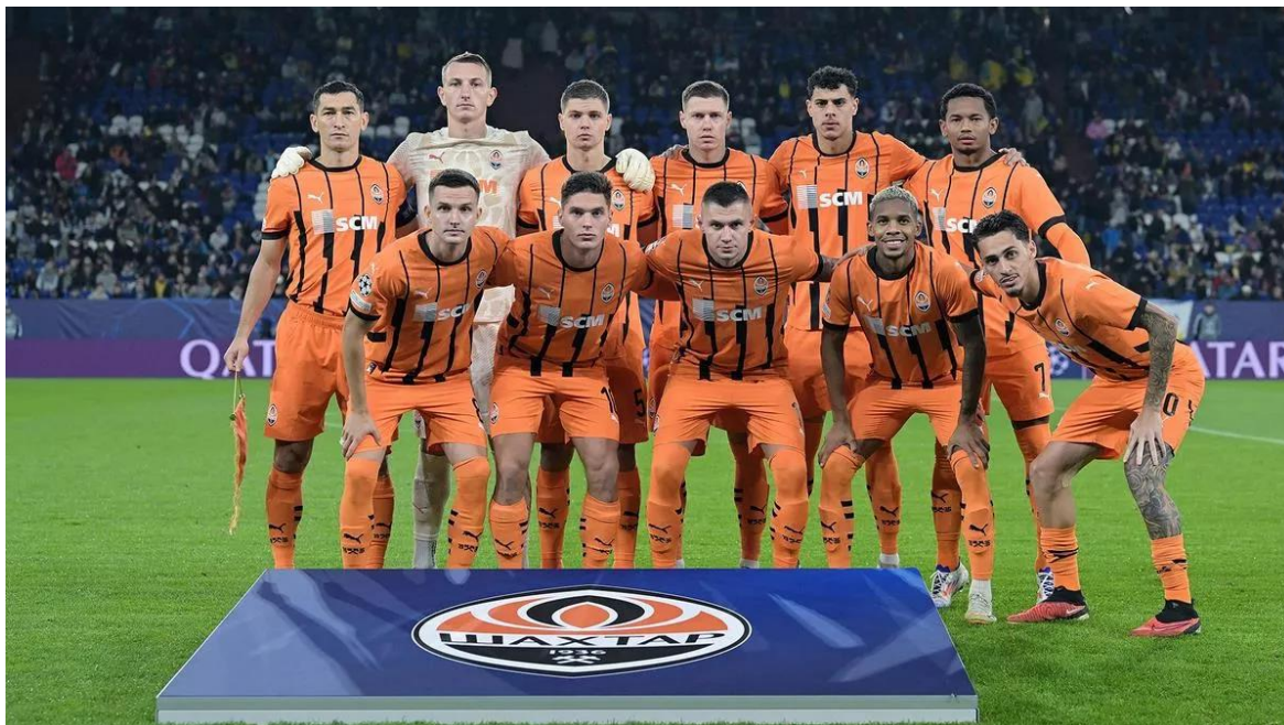
Рисунок 2.2 – футбольна команда "Шахтар" Донецьк [13]

міжнародній арені після здобуття незалежності. Окрім цього, "Шахтар" виграв понад 14 чемпіонських титулів у Прем'єр-лізі України, демонструючи стабільність і силу у внутрішніх змаганнях (рис .2.2).