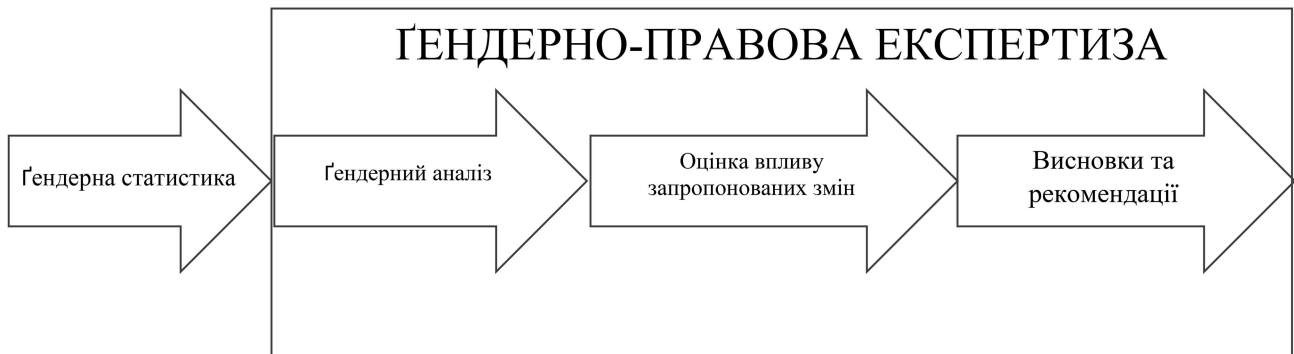
Рис. 2. Стадії гендерного процесу

Підсумовуючи оглядову частину нашої статті слід вказати на декілька загальних прогалин, що є спільними як для вітчизняної так і для закордонної наукової думки: 1. незначна кількість наукових статей, що містять результати впровадження практики гендерного бюджетування; 2. розпорошення напрямів дослідження; 3. слабка фінансова компонента досліджень.