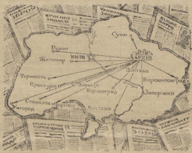
Схема проходження виробничої практики студентами четвертого і п'ятого курсів відділення журналістики влітку 1952 р.

Недостатня підготовленість в техніці оформлення газети виявилася в тому, що студенти не вміють правильно коректувати графіку, вичитувати сторінки, макетувати газетні шпальти. А проте, як свідчать листи багатьох випускників відділення журналістики, що працюють у газетах, саме технічне опрацювання матеріалів і оформлення газети займають велике місце в їх повсякденній роботі.