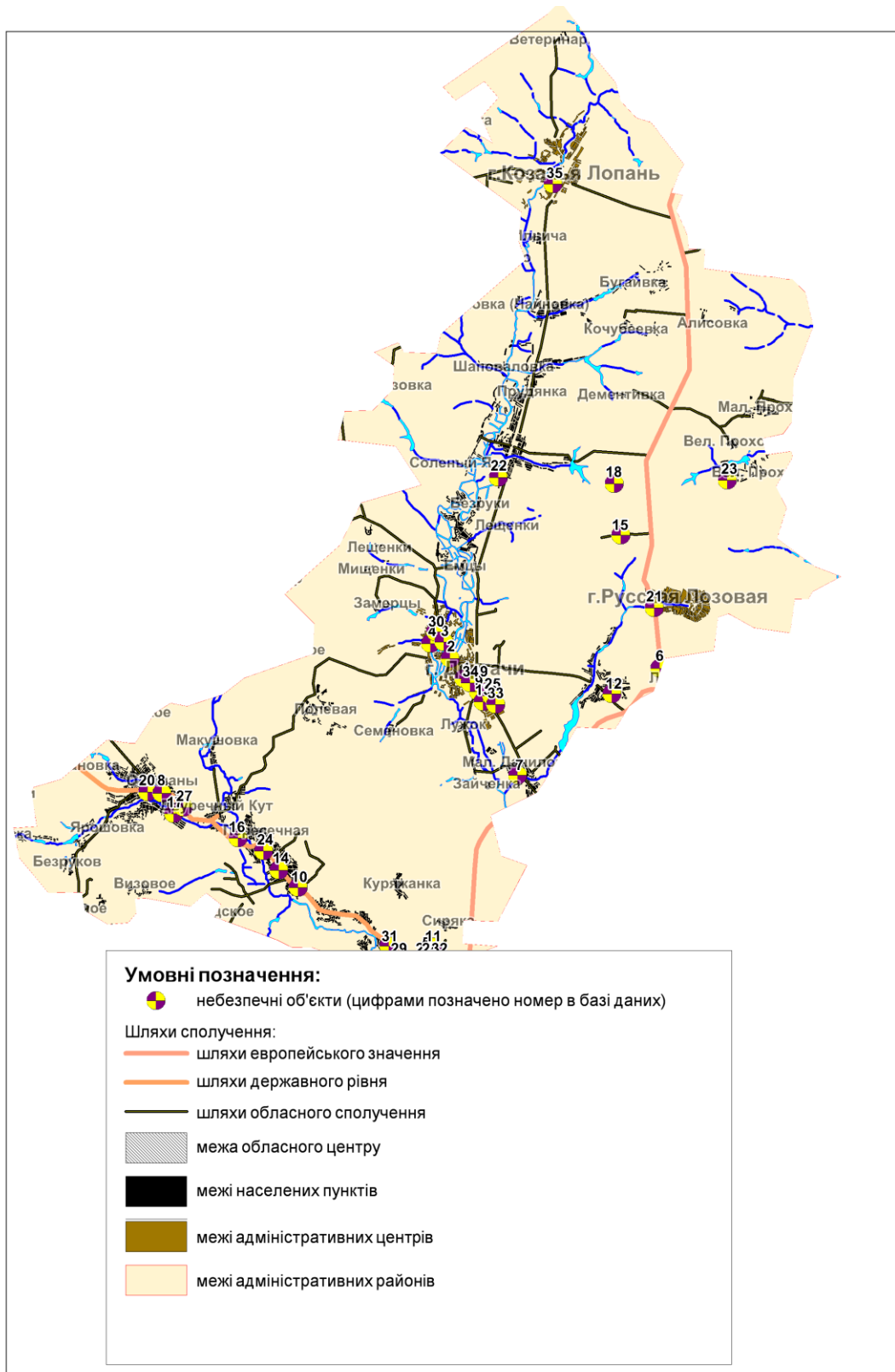
Рисунок 3 – Розташування потенційно небезпечних об'єктів на території Дергачівського району

7. Ежегодный доклад МАГАТЭ за 2006 год. GC(51)/5, 2007.