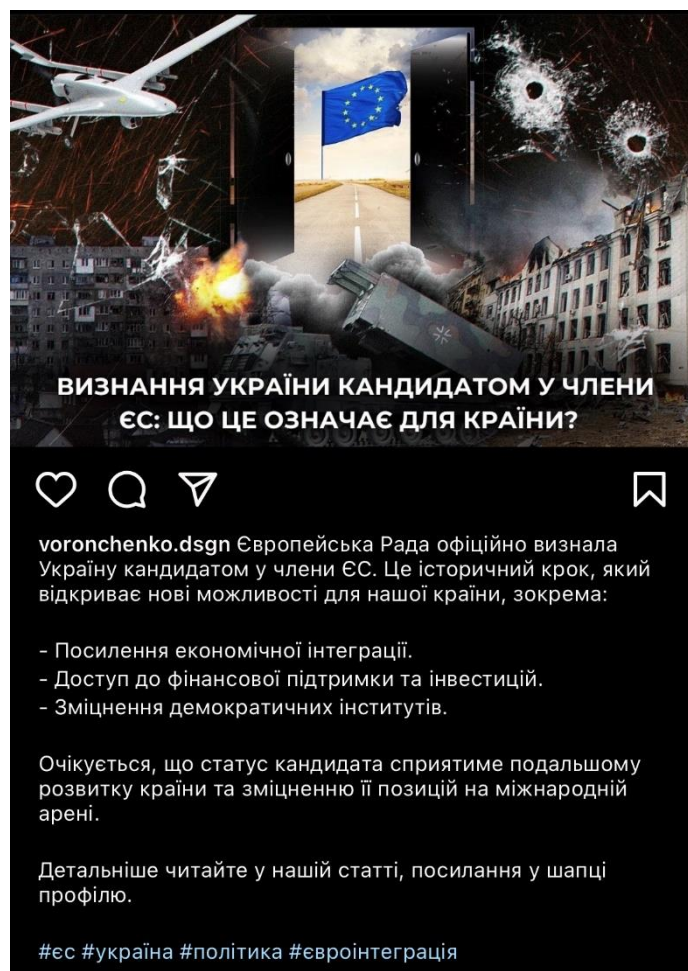
Рисунок А.1 – «Власний пост»

Мною було створено пост (рис. А.1) для соціальних мереж виходячи з журналістських стандартів та власних рекомендацій. Крім того, була написана стаття, що розкриває суть визнання України кандидатом у члени Європейського Союзу та його значення для країни. Метою створення цього контенту є демонстрація практичного застосування теоретичних принципів, описаних у дослідженні, а також ілюстрація того, як можна забезпечити об'єктивність, прозорість та етичність у висвітленні важливих політичних подій.