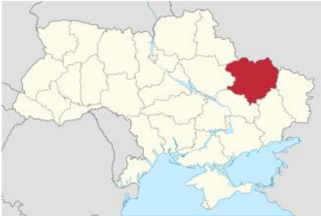
Рис. 2.1. Харківська область на карті України [27]

Харківська область розташована на північному сході України і належить до Східноєвропейської рівнини. За адміністративно-територіальним устроєм область охоплює площу близько 31,4 тис. км 2 , що становить приблизно 5,2% від загальної площі держави. Територія включає 7 районів та понад 50 громад, з центром у місті Харкові – одному з найбільших індустріальних, наукових і освітніх центрів України (рис. 2.1.).