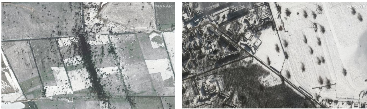
Рис. 3.2. Фрагменти супутникових зображень [24]

Повномасштабна збройна агресія Російської Федерації проти України, що розпочалася у 2022 році, зумовила катастрофічні зміни у природному середовищі, особливо в прифронтових регіонах. Одним із найбільш постраждалих компонентів є ґрунтовий покрив, який зазнав глибокої фізичної, хімічної та біологічної трансформації. У Харківській області, що стала епіцентром тривалих бойових дій, зафіксовано значні площі пошкоджених і деградованих ґрунтів, просторовий розподіл яких був встановлений за допомогою супутникових знімків Sentinel-2, WorldView та GeoEye.