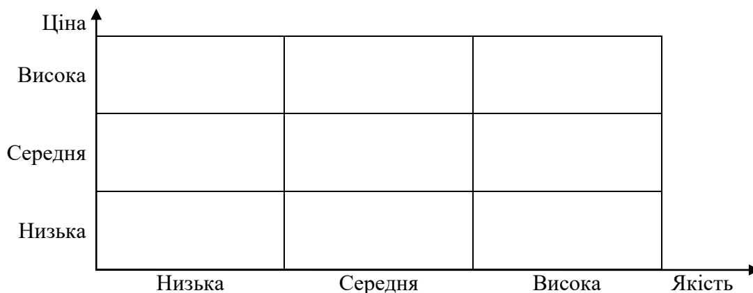
Рисунок 2.1. Графік «ціна-якість»