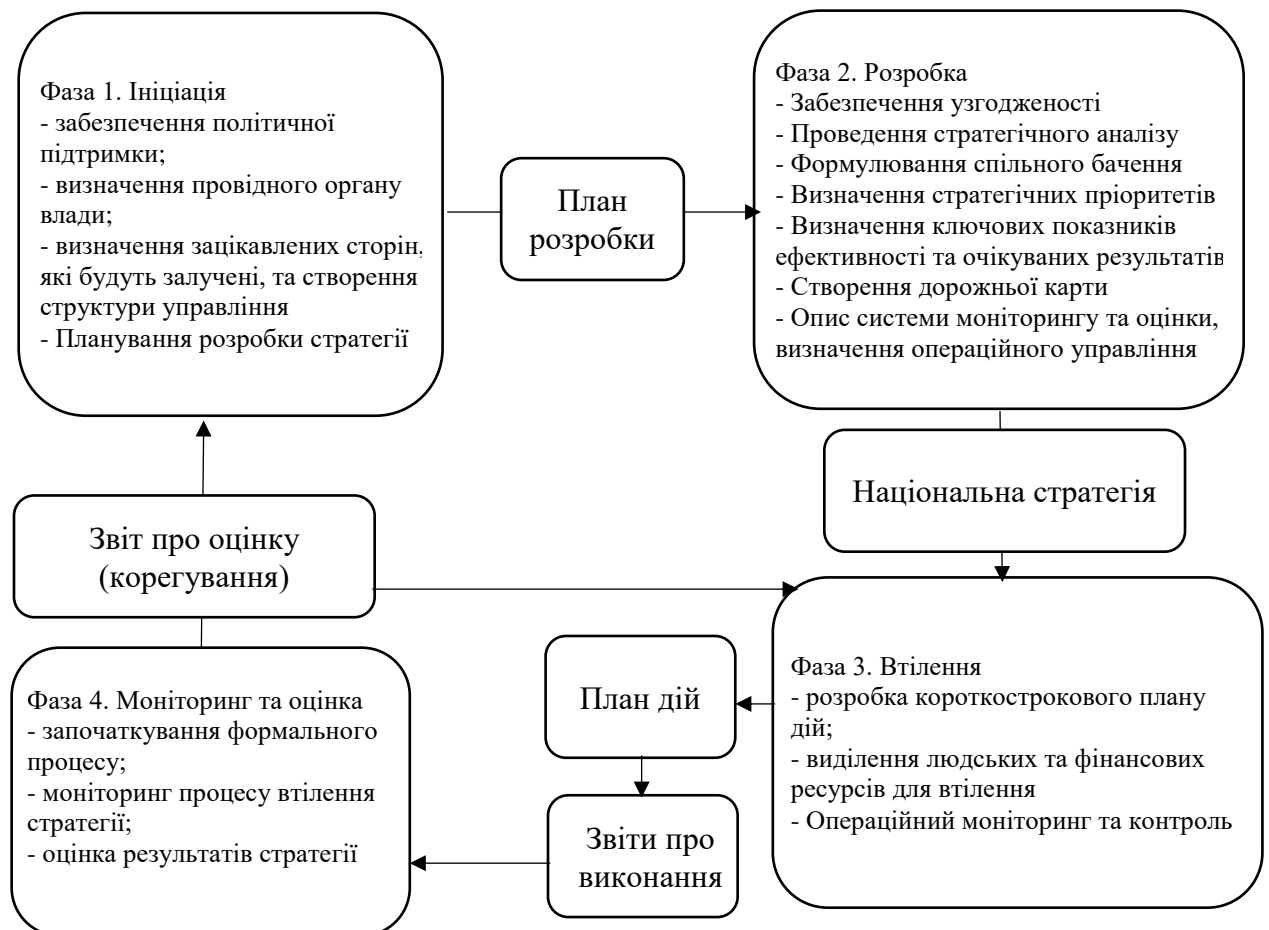
Рисунок 2.2. – Цикл розробки DTS [29]

Жодної єдиної стратегії цифрової трансформації не визначено. Він має бути пристосований до конкретних характеристик кожної країни, включаючи її політичний, соціальний та економічний склад, її керівництво, культуру та загальну складність системи, серед іншого. DTS матиме унікальне поєднання досвіду, концепцій, інструментів і ресурсів, які вже доступні. Однак створення DTS завжди буде поступовим, як показано на малюнку 1.