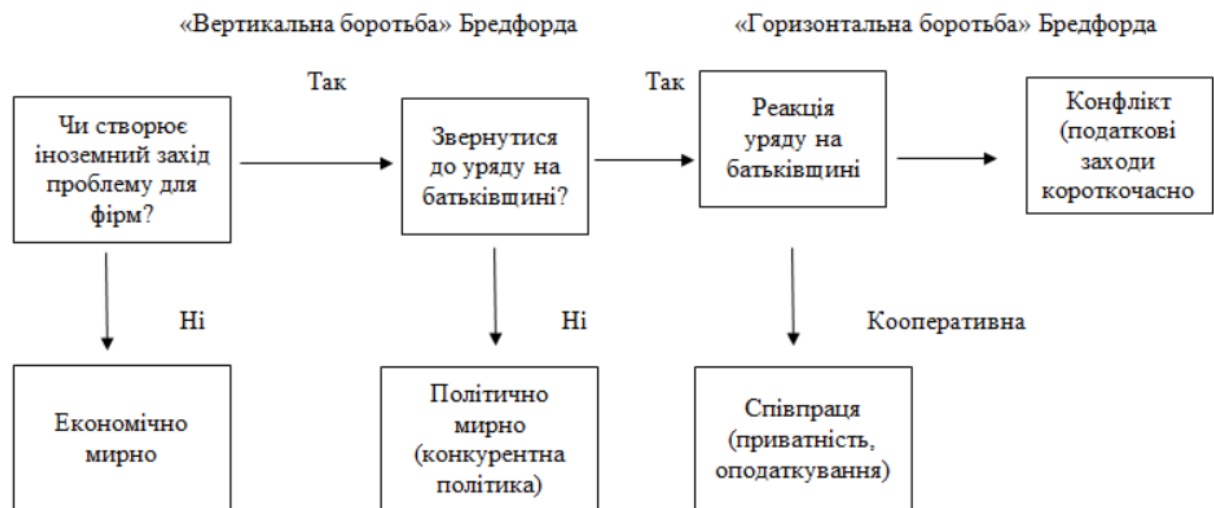
Рисунок 2.1. – Співпраця та конфлікт у трансатлантичних відносинах за високих економічних ставок [17]

Провідні регуляторні сили – Китай, ЄС і США – зараз стурбовані згубними соціальними наслідками цифрової трансформації. Щоб вирішити ці проблеми, вони повинні боротися з розбіжністю між визначеною юрисдикцією їхньої території та цифровою економікою в усьому світі. Китай вирішив відповідати діяльності та повноваженням і обмежити цифрові технології своїми національними кордонами у формі «Великого брандмауера». ЄС намагається досягти «цифрового суверенітету», намагаючись наслідувати правила світу. США ще не впоралися з напругою. Стратегія Китаю обмежує його вплив на управління глобальною цифровою економікою, але кілька його компаній є значними учасниками цієї сфери та намагаються визначити стандарти, які керуватимуть цифровим сектором. Таким чином, значення Китаю різне в кожному прикладі цієї спеціальної збірки. Постійними учасниками є американці та європейці.