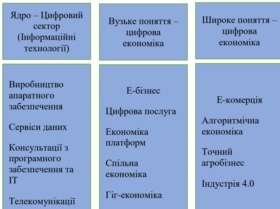
Рисунок 1.3. – Сфера охоплення економіки цифрової економіки [44]

Наприклад, організації на основі платформ можна об'єднати. Це більш очевидно для таких компаній, як Google і Facebook, які за своєю суттю є цифровими; незрозуміло з такими платформами, як Alibaba, eBay і Amazon; і досягає дифузного виміру з такими компаніями, як Uber і Airbus. Однак ми можемо визначити останні як надійні в рамках визначення цифрової економіки, тому що це... компанії, які не пов'язані з розміщенням чи послугами таксі; вони складаються з цифрових компонентів, створених за допомогою цифрових ініціатив і цифрових моделей організації.