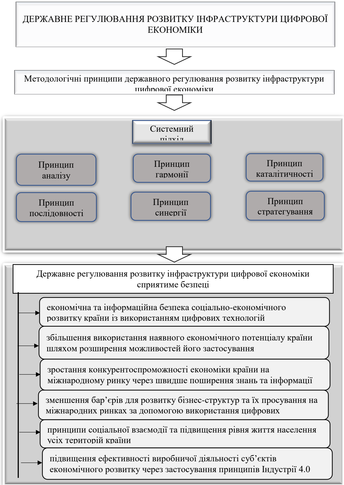
Рисунок 1.4 Методологічні принципи державного регулювання розвитку інфраструктури цифрової економіки.