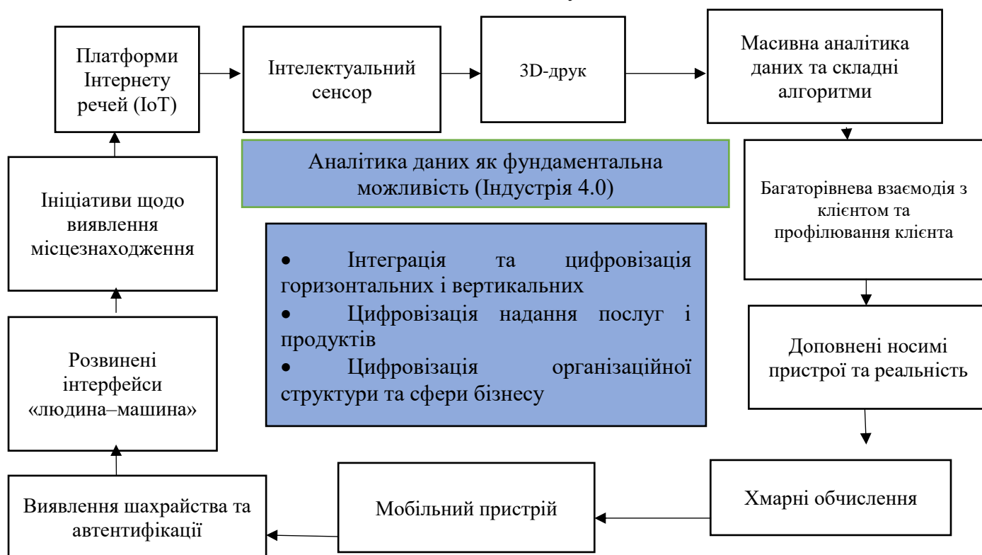
Рисунок. 1.1 – Структура для Індустрії 4.0. [18]

Результати будь-яких зусиль можна розглядати як вплив обсягу та величини результатів. Оскільки зростання в країнах, що розвиваються, супроводжується зростанням величини результатів із більшою доступністю, вплив цифрових технологій на цифрову економіку швидко зростає. Наслідки розглядаються як втручання в існуючу економічну діяльність, галузі та системи; визначення поточних дій споживачів, ділової співпраці та корпоративних структур. З цієї причини це сприймається як розвиток нових економічних систем, видів діяльності та галузей.