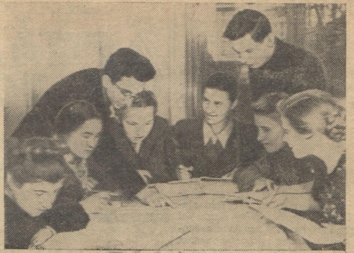
Студенти-фізгеографи III курсу готуються до наступної практики в долинах рік Дніпра і Ворскли.