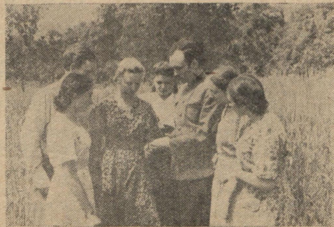
Рік тому вони подавали заяви про вступ на біологічний факультет. А сьогодні — це студенти II курсу. На фото: група студентів на практиці в Ботанічному саду. Керівник — асистент В. П. Кудокіцев.