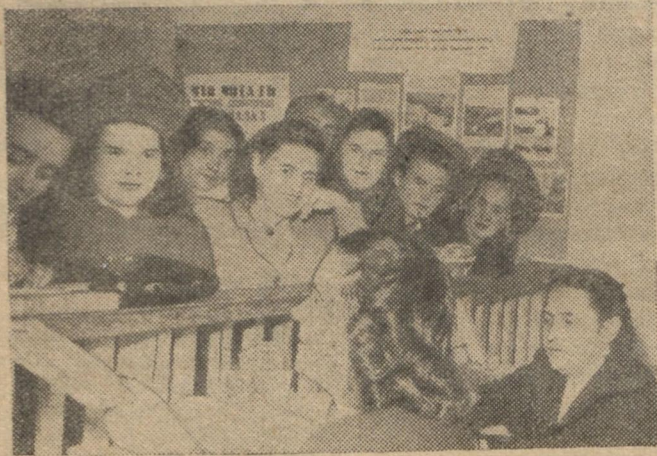
Складено останній екзамен! Гарячі дні сесії залишилися позаду. Попереду — літо, заслужений відпочинок. Людино сьогодні в університетських бібліотеках. Десятки тисяч книжок взято було студентами у дні екзаменів. Тепер вони повертаються на полиці до наступного учебного року. На фото: в учбовій бібліотеці на філологічному факультеті.