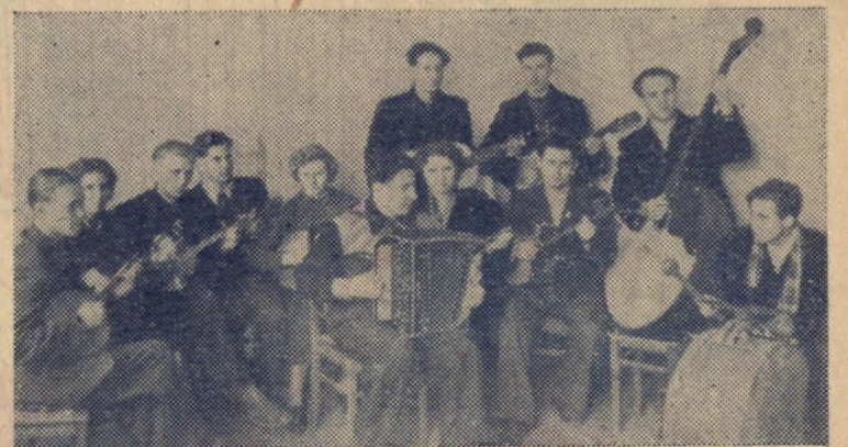
Струнний оркестр історичного факультету під час підготовки до факультетського фестивалю.

студент п'ятого курсу історичного факультету, член гуртка Історії КПРС.