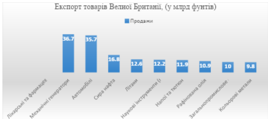
Рис 1.4 10 товарів Великої Британії для експорту у 2024 році. Складено автором за матеріалами: [14]

Імпорт відіграє вирішальну роль у торговельних відносинах країни, а 10 основних товарів, що імпортуються Великою Британією, можуть дати цінну інформацію про її економіку.