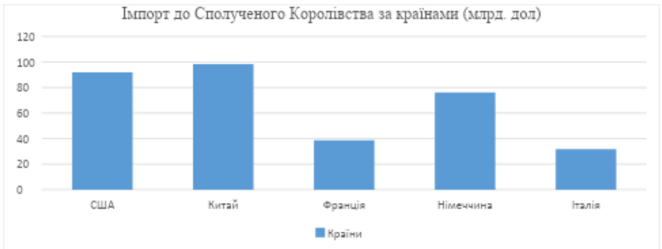
Рис. 1.6 Імпорт до Сполученого Королівства за країнами. Складено автором за матеріалами: [65]

Загальний обсяг імпорту Сполученого Королівства у 2024 році склав 809,21 млрд доларів США. Основними партнерами Сполученого Королівства з імпорту були: Китай, Сполучені Штати та Німеччина.