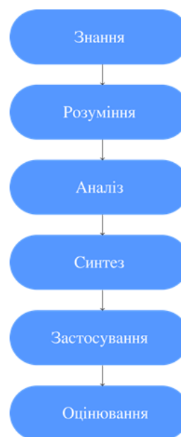
Рис. 1. Схема таксономії Блума

Зазначена схема включає такі складники-рівні: – знання, що складають основу критичного мислення. На цьому рівні людина може чітко окреслити та запам'ятати ключові поняття, факти та теорії; – розуміння, що передбачає не просто запам'ятовування інформації. Людина здатна переказувати її своїми словами, пояснювати суть