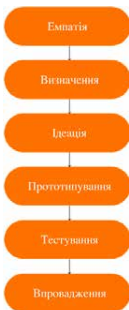
Рис. 2. Методологія дизайн-мислення [8]

Така синергія досягається в деяких університетах Сполучених Штатів Америки, наприклад Національному Університеті Флориди в Маямі, де