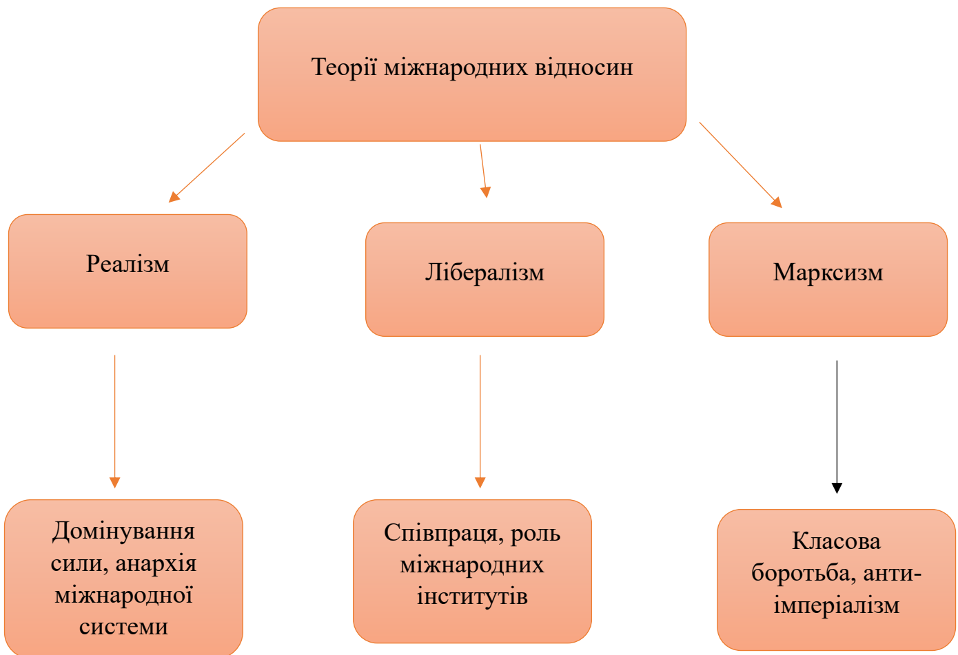
Рис. 1.1. Еволюція розвитку наукових шкіл з міжнародних відносин

стимулом що формує міжнародну політичну арену та відносини в ній, минулі події, такі як колонізація і війни, впливають на політичні та економічні структури в будь який час, й через це вивчення та аналіз історії є невід'ємною частиною марксизму, який прагне створити рівне суспільство в усьому [3]. Отже, марксизм як теорія міжнародних відносин є цінним інструментом для аналізу сучасних глобальних проблем, показуючи, що економіка та політика тісно пов'язані, і класові інтереси продовжують впливати на міжнародні стосунки. Можна окреслити в схемі, що пропонує Теорія міжнародних відносин та її теорії (схема 1.1.)