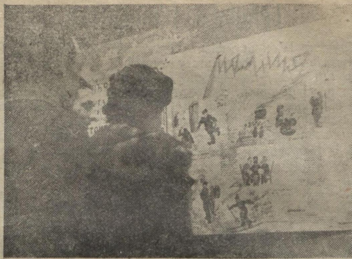
На фізико-математичному факультеті виходить гостра і добре оформлена «Молнія». На фото: біля свіжого номеру.