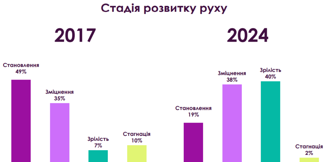
Рис. 1 – Стадії розвитку феміністичного руху у 2017 та 2024 році, Український Жіночий Фонд.

З 2017 року, коли дослідження проводилося вперше, ситуація щодо самосприйняття свого розвитку рухом змінилася доволі відчутно. У перший рік дослідження, у 2017 році, 49% респондентів відповіли, що український феміністичний рух є на стадії становлення, а 7% – що вже на стадії зрілості. Цьогорічне опитування ж виявило те, що 40% опитаних вважають рух зрілим, і тільки 19% відносять його ще до такого, що становиться (рис. 1) [36].