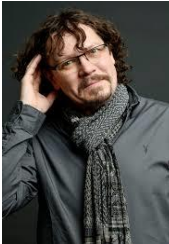
Рисунок 2.1 -Портрет Томаса Сандози

Літературний дебют Томаса Сандоза відбувся у 2000 році, коли він опублікував свій перший роман, який одразу привернув увагу літературної критики та широкої читацької аудиторії [12, с. 142]. Від початку своєї творчої кар'єри письменник демонстрував зацікавлення темами соціальної нерівності та маргіналізації, що у поєднанні з глибоким психологічним аналізом формує унікальний авторський стиль. У своїх творах Сандоз досліджує людське існування крізь призму внутрішніх конфліктів та суспільних викликів, поєднуючи емоційну виразність із філософськими роздумами [15, с. 87]. Одним із найвідоміших його романів є «La ballade des perdus» (2018), у якому автор майстерно розкриває теми соціальної ізоляції, психологічного болю та пошуку ідентичності. Критики відзначають, що саме цей твір став знаковим у його кар'єрі, оскільки поєднує інструменти психологічного портрета, соціального коментаря та витонченого художнього письма [9, с. 54].