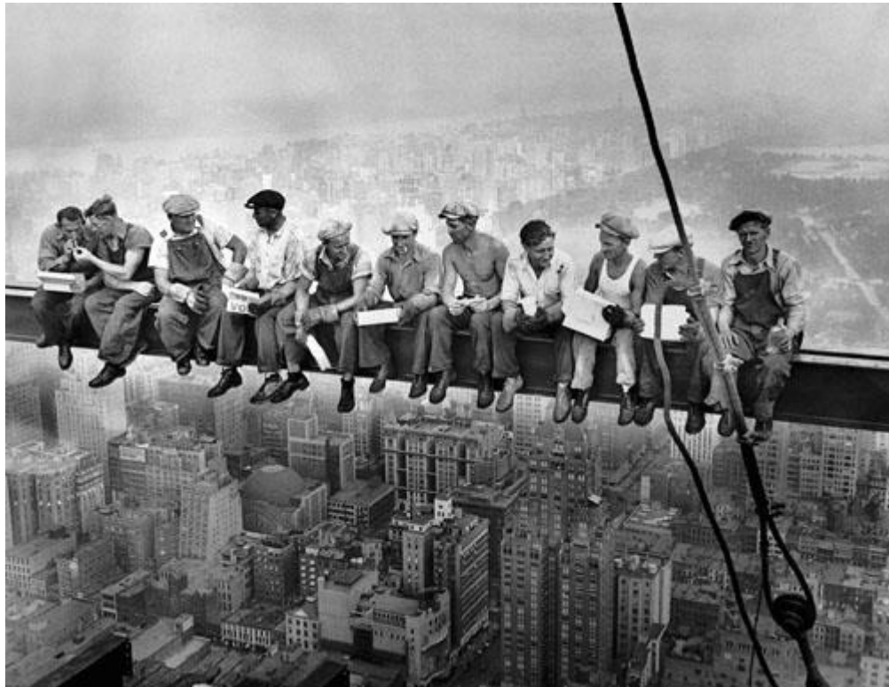
Рис. 1.1 Обід на хмарочосі [8]

Чарльза Клайда "Нью-йоркські робітники які обідають на поперечній балці" або "Обід на хмарочосі", на якій 11 будівельників обідають на стрілі підйомного крану (рис. 1.1). Журнал Time у 2016 році включив цю фотографію до списку 100 найвпливовіших зображень усіх часів і її часто використовують як ілюстрацію до історії розвитку кейтерингу [8].