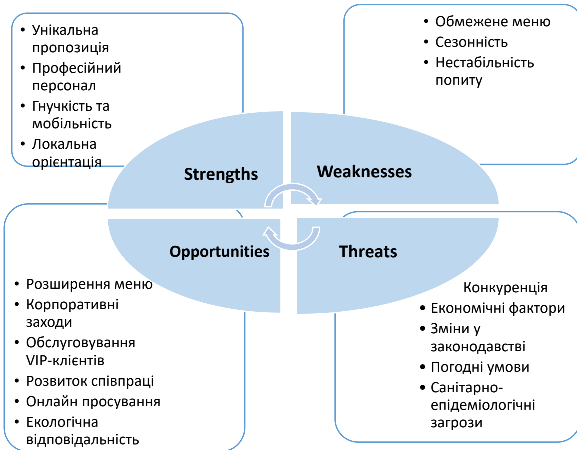
Рис. 2.1 SWOT-аналіз кейтерингової компанії «BBQ-style»