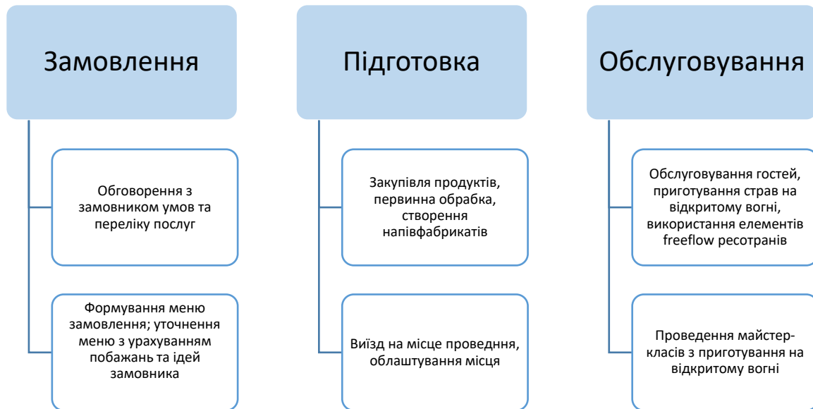
Рис. 2.2 Типовий сценарій обслуговування в компанії «BBQ-style»

Типовий сценарій обслуговування замовлень наведено на рис. 2.2.