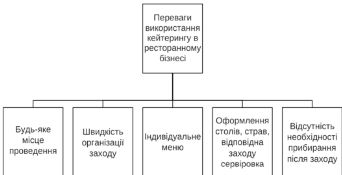
Рис. 1.2 Переваги кейтерингу як виду ресторанного бізнесу [32]

Загалом кейтеринг має багато переваг порівняно з традиційним ресторанним обслуговуванням (рис. 1.2), що робить його все більш популярним.