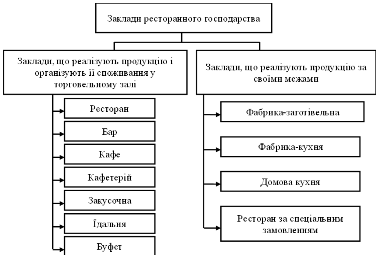
Рис. 2.1 Загальна класифікація закладів ресторанного господарства

Заклади ресторанного господарства класифікуються на такі, що реалізують продукцію і організують її споживання у торговельному залі, та ті, що реалізують продукцію за його межами. На рисунку 2.1 наведено загальну класифікацію закладів ресторанного господарства.