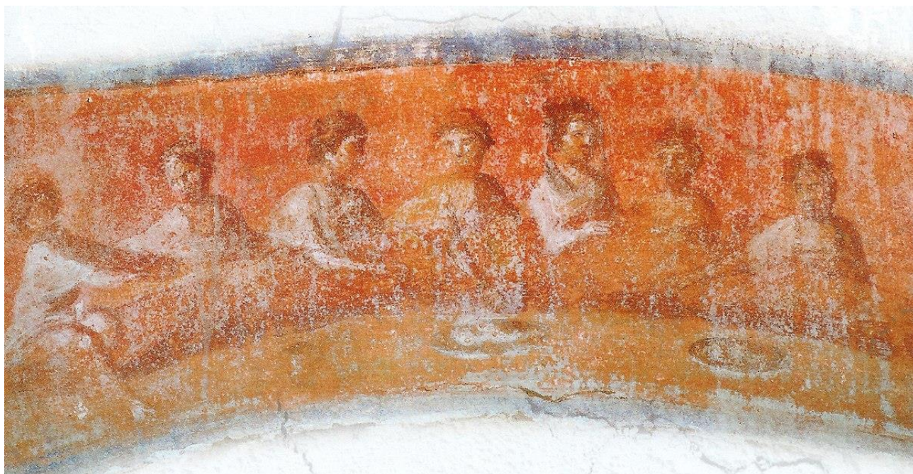
Рис. 5. Римська катакомба (II–IV ст.) із зображенням агапе-вечері (дроблення хліба) – одна з найперших християнських сцен спільної трапези, що відрізняється від юдейського пасхального седеру. 243