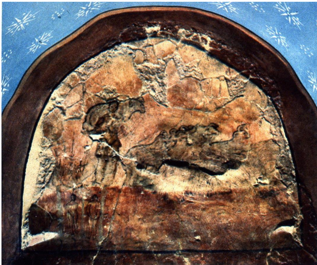
Рис.2. Фреска «Добрий Пастир» у християнському баптистерії Дура-Европос (середина III ст.), де християнська іконографія уперше з'являється в міських розписах, незалежно від юдейських традицій. 240