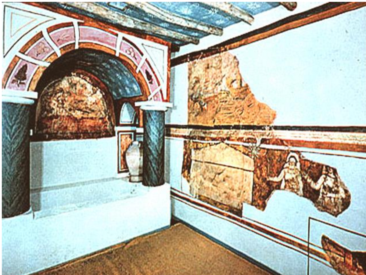
Рис.3. Римська катакомба (II–IV ст.) із зображенням агапе-вечері (дроблення хліба) – одна з найперших християнських сцен спільної трапези, що відрізняється від юдейського пасхального седеру. 241