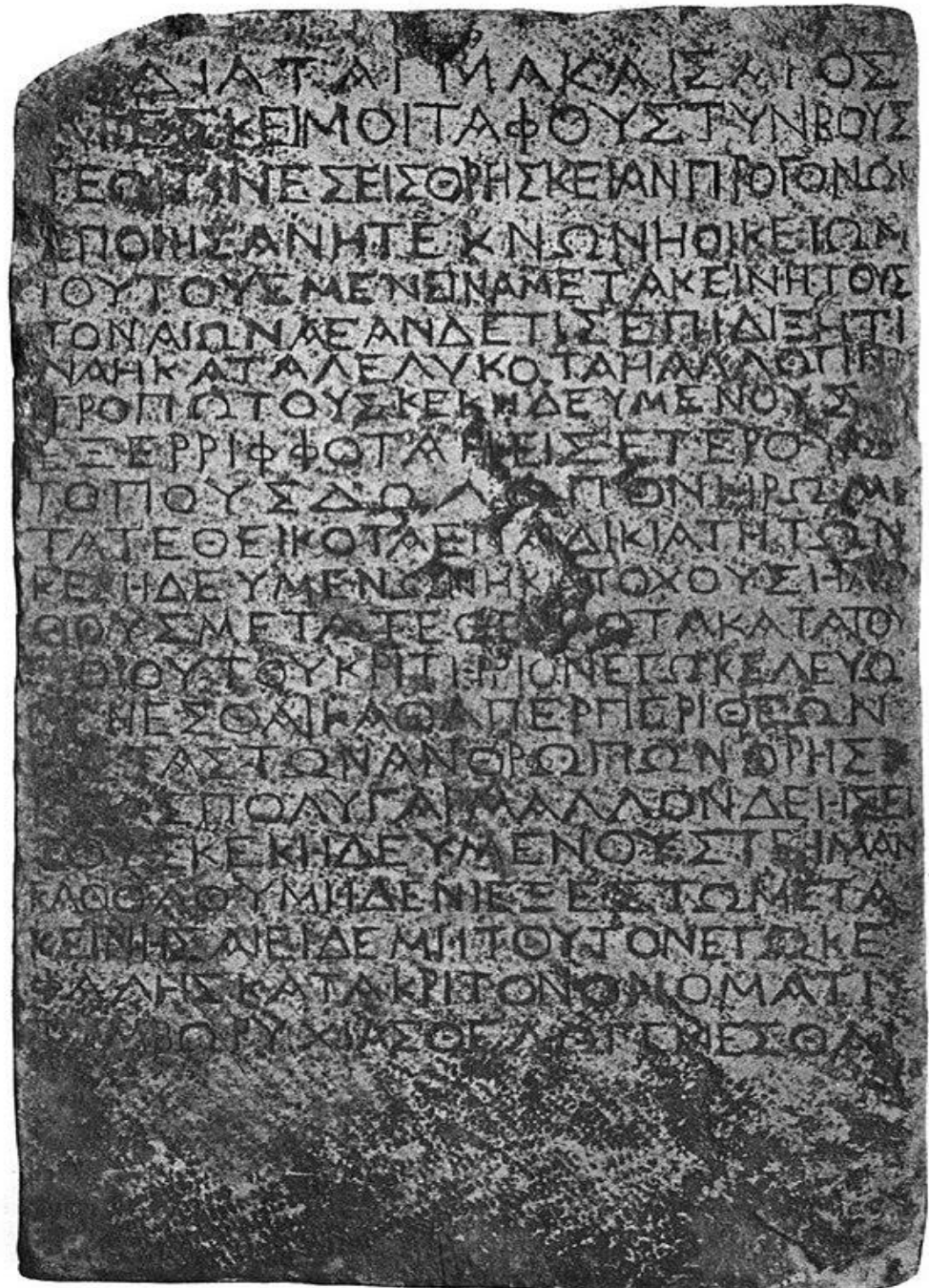
Рис.1. Імператорський указ (близько поч. II ст. н.е.), вирізаний у камені, який забороняє порушувати могили. Інтерпретується як реакція на віру в учіння про воскресіння й демонструє зростаючий правовий конфлікт між християнами та імперською владою. 239