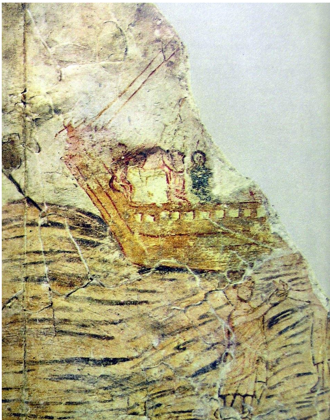
Рис.4.Стінепис у баптистерії, що відображає християнські дивотвори незалежно від юдейського контексту єврейських пророків. 242