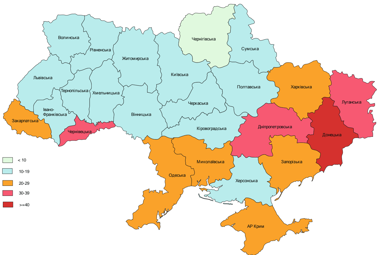
Рис. 9. Щільність злочинів, скоєних неповнолітніми