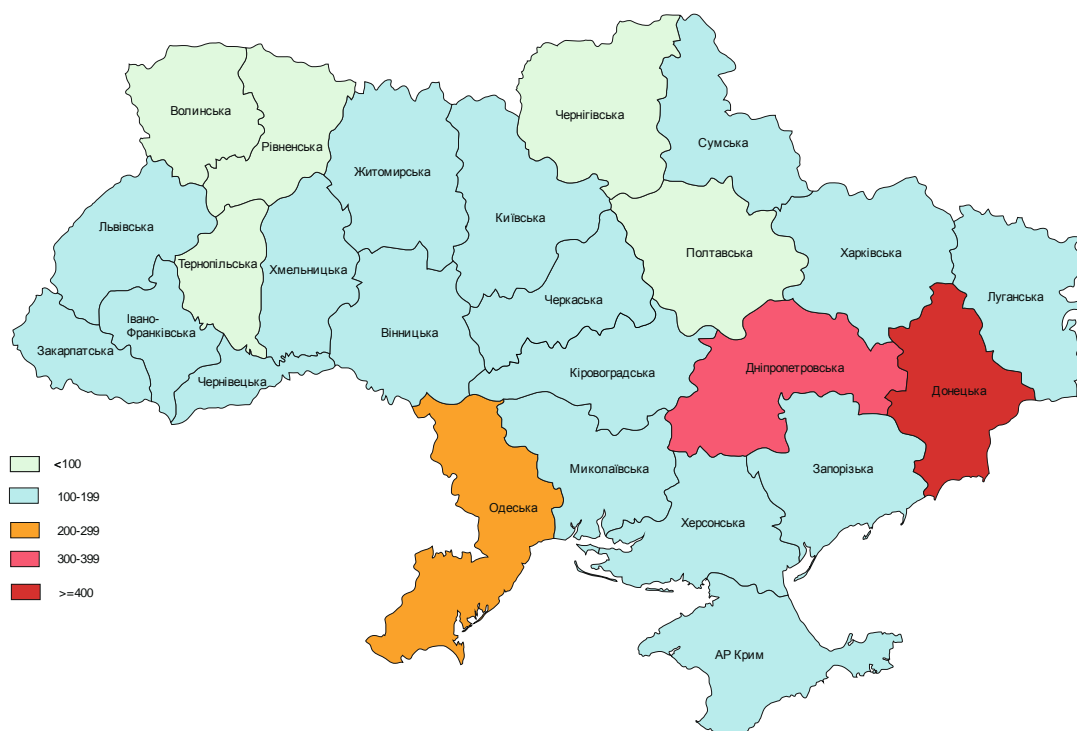
Рис. 7. Щільність дітей-сиріт та дітей, позбавлених батьківського піклування, у 2010 році