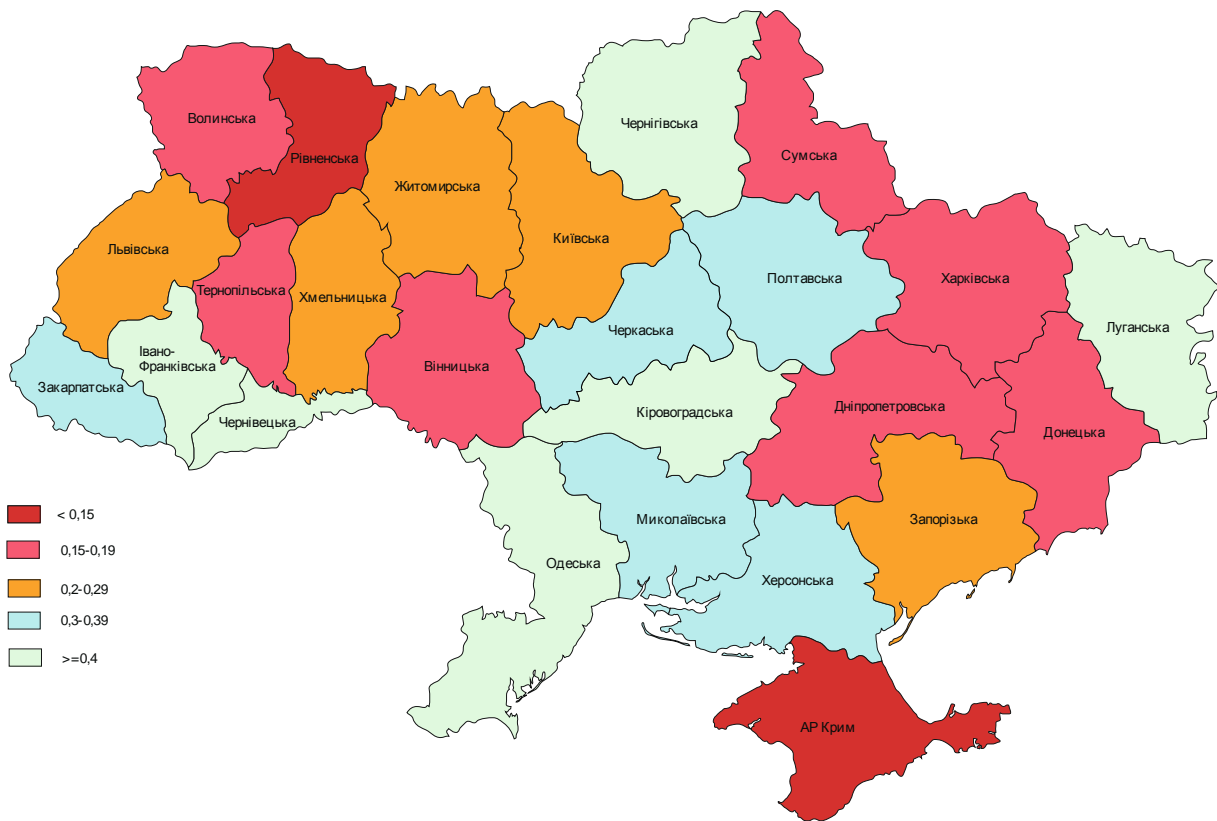
Рис. 3. Насиченість інтернет-провайдерами на 10000 осіб у 2011 році