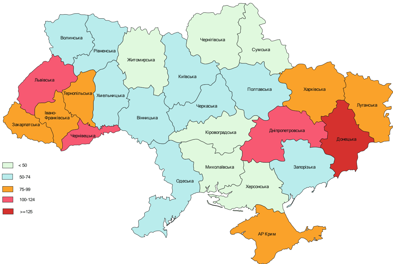
Рис. 1. Щільність населення у 2010 році, осіб на км 2