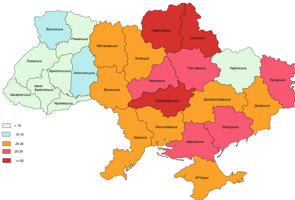
Рис. 10. Коефіцієнт смертності від самоушкоджень у 2010 році

На рис. 10 наведено картографічне відображення коефіцієнту смертності від самоушкоджень по областях України. На жаль, немає повної картини щодо кількості самоушкоджень взагалі, можливо тоді картина б дещо змінилася, але навіть у разі тільки зафіксованих смертей від самоушкоджень можна зробити висновок, наскільки цей коефіцієнт є нижчим у західних регіонах. Донецька область за рівнем самогубств (22,8%) посідає 16 місце. Але навіть цей показник приблизно у два рази вищий ніж у західних областях, а якщо порівняти з Львівською областю, де цей показник є найнижчим (7,9%), то він більше майже у 3 рази [8, с. 197].