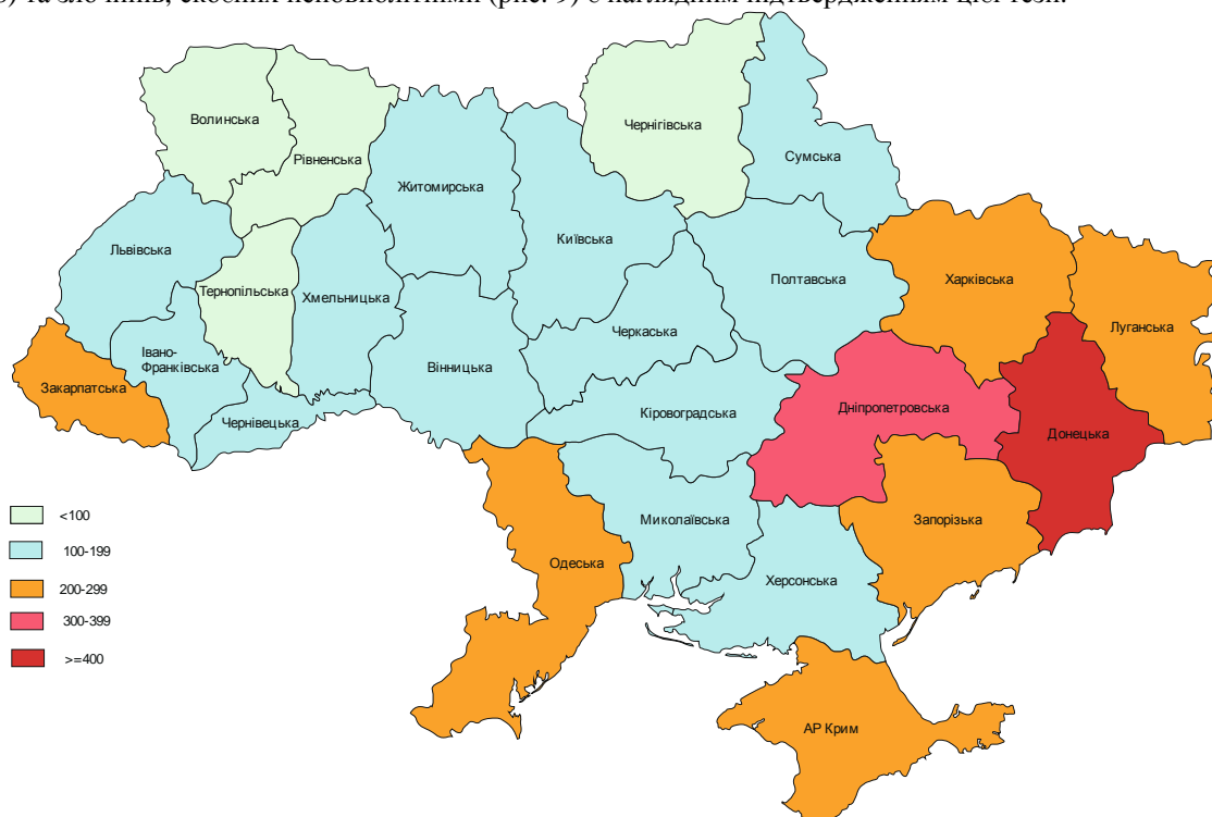
Рис. 6. Щільність дітей, народжених поза шлюбом, у 2010 році

Ці індикатори відображають стан духовної складової якості життя населення, що впливає на соціально-економічний розвиток території, бо багато чинників опосередковано залежать і від рівня релігійності населення регіону. В Донецькій області індекс рівня розвитку соціального середовища протягом останніх років постійно знижувався і з середнього став нижче середнього. Наприклад, у областях з фактично вже створеною інституційною мережею релігійних організацій (західний регіон) значно нижчий рівень самогубств, щільність наркоманів, розлучень, дітей, народжених поза шлюбом, дітей-сиріт та дітей, позбавлених батьківського піклування, зареєстрованих злочинів та злочинів, скоєних неповнолітніми. Щільність дітей, народжених поза шлюбом (рис. 6), та дітей-сиріт і дітей, позбавлених батьківського піклування (рис. 7), зареєстрованих злочинів (рис. 8) та злочинів, скоєних неповнолітніми (рис. 9) є наглядним підтвердженням цієї тези.