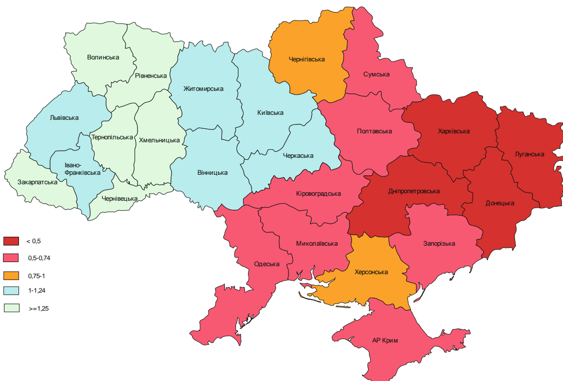
Рис. 5. Насиченість релігійними установами на 1000 осіб станом на 1 січня 2012 року