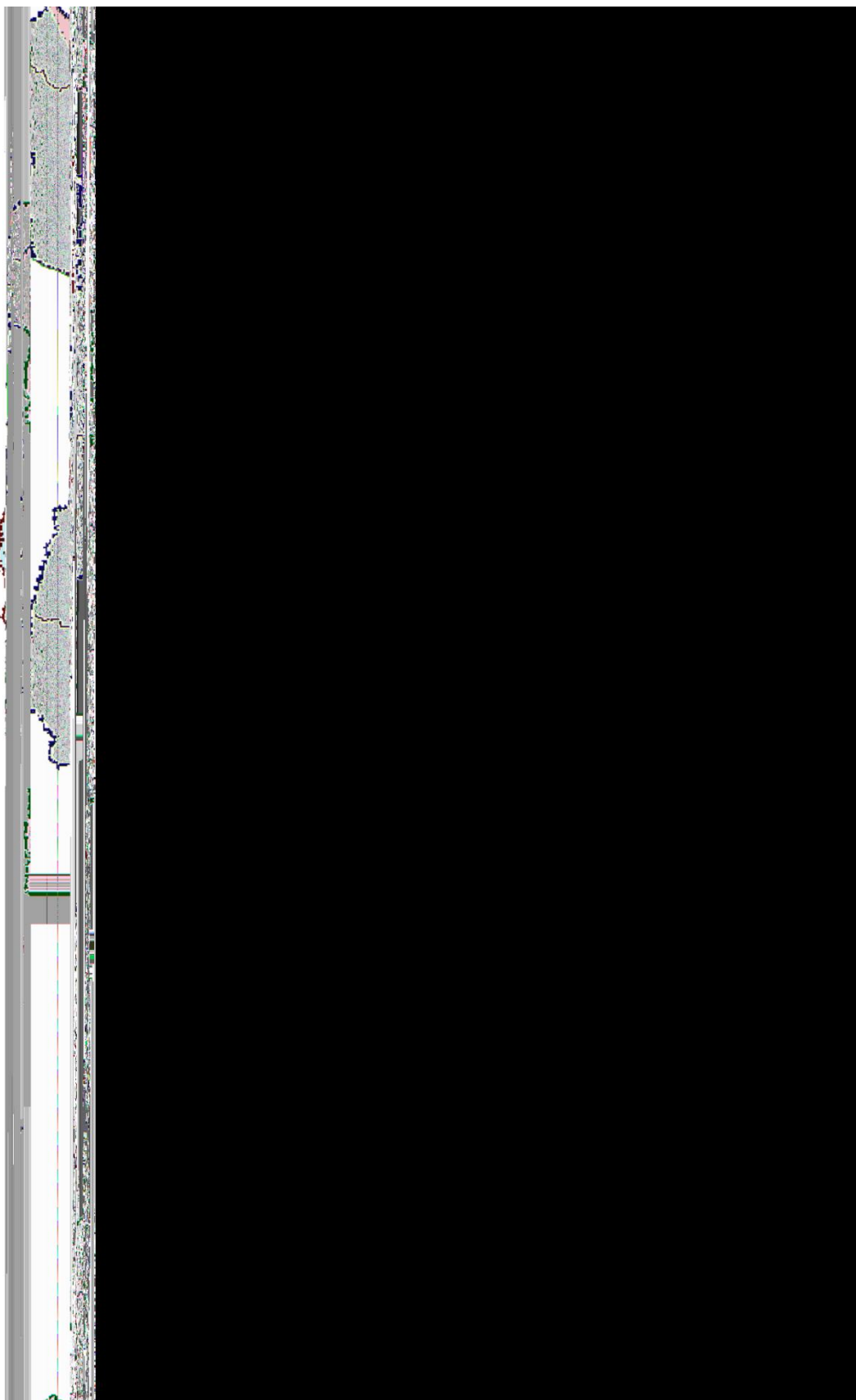
Додаток 4. Агрокліматичне районування території України 1986 р. [Т. І. Адаменко, 2014]