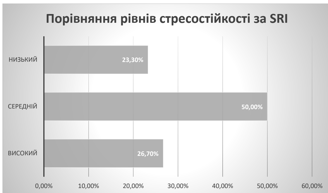
Рис. 2.1. Розподіл рівнів стресостійкості серед респондентів вибірки по методиці “Шкала стресостійкості” (SRI).

Для наочності відмінності рівнів стресостійкості респондентів представлено на Рис. 2.1.