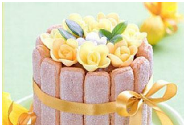
Рисунок 2.1 – Оздоблення боковика торта з використанням печива савоярді

Назву рисунка розміщують під ілюстрацією та відцентрують. Якщо рисунок є запозиченим, то під ним зазначають джерело інформації згідно зі списком літератури. Наприклад: