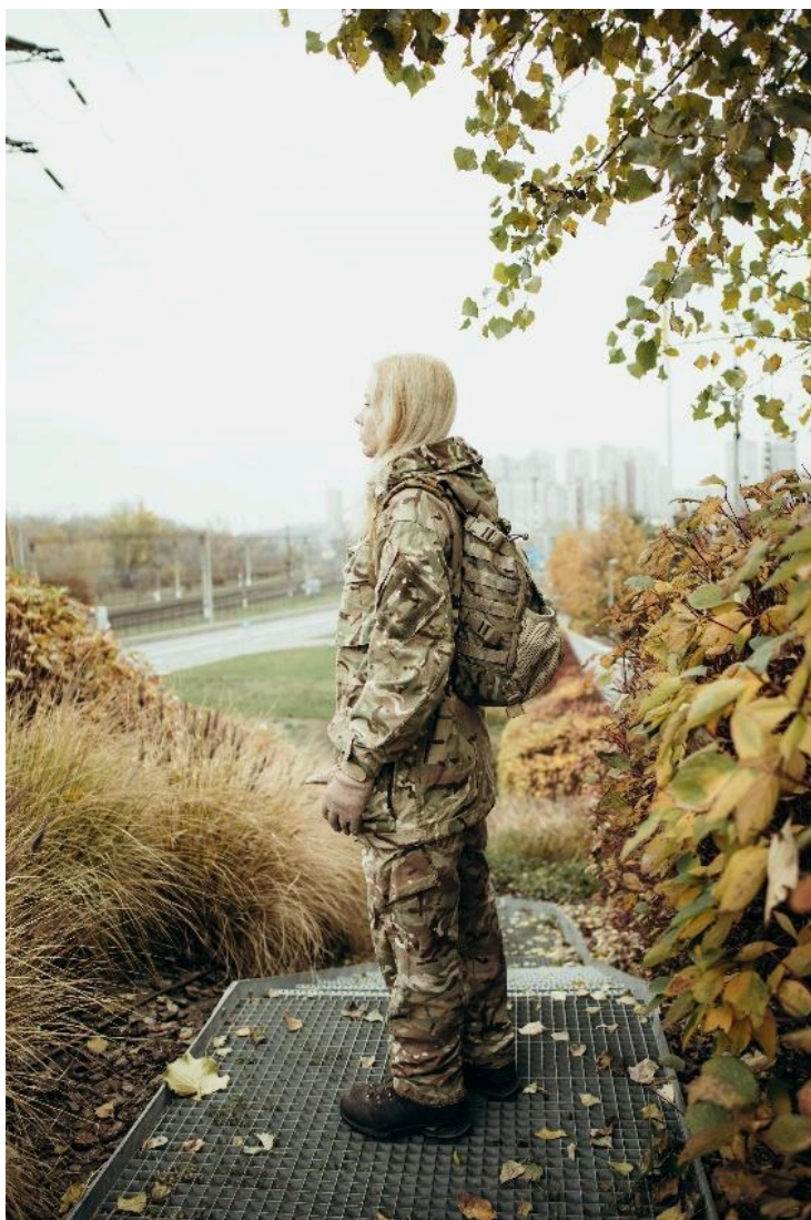
Фото 10. Міська локація для військового фото.