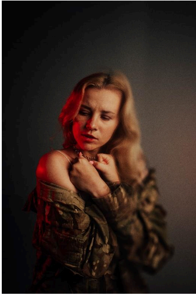
Фото 5. Приклад спліт світла з використанням сот з червоним фільтром та лінзою «Половинка». Автор Софія Пономаренко