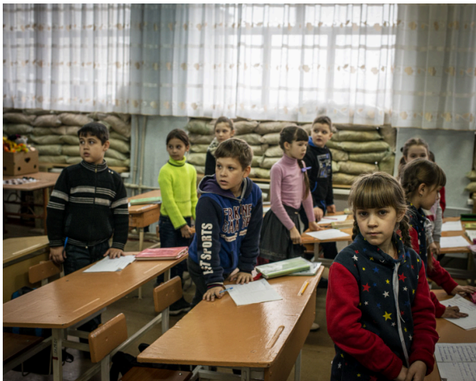
Фото 4. Українська криза. Автор Гійом Ербо