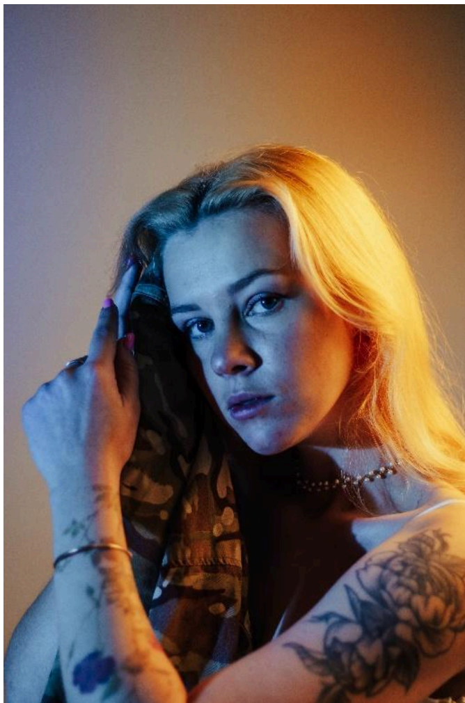
Фото 8. Приклад фронтального світла з додаванням бічного.