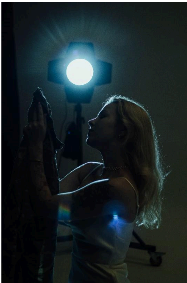
Фото 3. Приклад роботи з контровим світлом