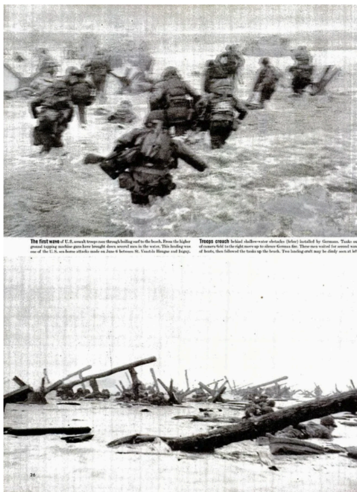
Рис. 2.2 Приклад 1. Репортаж з пляжу Омаха для журналу LIFE зі світлинами Роберта Капи від 19 червня 1944 року [11]

Г. Казакевич продовжує, що саме у 1939 році Роберт Капа емігрував до США, але через кілька років повернувся до Європи разом із американськими військами. Найвизначнішим моментом його кар'єри став репортаж із висадки союзників у Нормандії 6 червня 1944 року, зокрема на пляжі Омаха. Його фотографії, що зображують розбиту техніку, переляканих солдатів під кулеметним вогнем і героїв, які йшли в саме пекло бою, стали символом Дня «Д» і надихнули Стівена Спілберга на створення фільму "Рятуючи рядового Раяна" . Капа того ж дня відправив три плівки до лондонської редакції, але під час проявлення молодий лаборант через перегрів плівок зіпсував більшість знімків, залишивши лише кілька історичних кадрів. Це стало легендою, яку довго підтримували Капа та його редактор Джон Морріс. (див. рис. 2.2, 2.3).