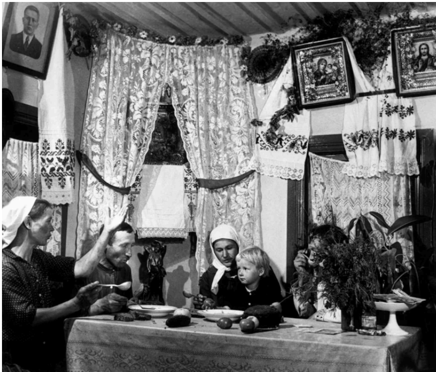
Рис. 2.4 Обід працівників колгоспу, який відвідав Капа в 1947 році [11]

вони вирізняються бездоганною технічною майстерністю та художньою досконалістю (див. рис 2.4).