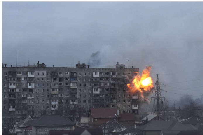
Фото 2. Облога Маріуполя. Автор Євген Малолетка