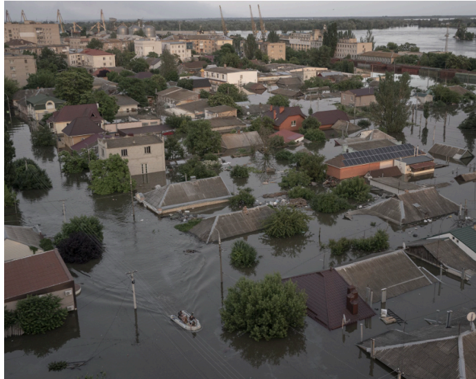
Фото 1. Каховська дамба: повінь у зоні бойових дій. Автор Йоган Марія