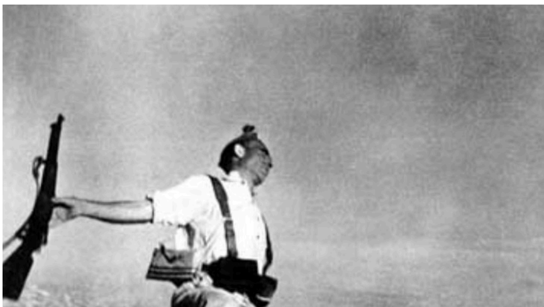
Рис. 2.1 Легендарний знімок “Смерть республіканця” Роберта Капи [11]

найбільш відомих знімків Капи є «Смерть республіканця» [11], що зафіксував момент загибелі республіканського бійця під час Громадянської війни в Іспанії (див. рис 2.1). Доктор історичних наук зазначає, що фотографія стала іконічною, вона передає драматизм та безпорадність ситуації війни. Її атмосфера дозволяє глядачеві відчути напругу та страх, які супроводжують військові дії. Цей знімок відображає відвагу фотографа, який був готовий ризикувати власним життям, щоб показати правдиву картину війни.