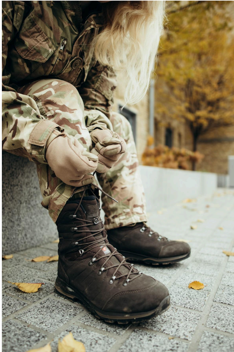
Фото 13. Приклад роботи над деталями фото-історії. Автор Софія Пономаренко