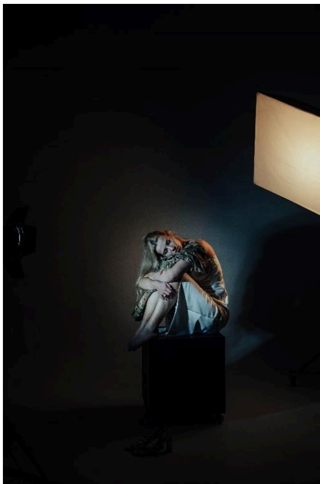
Фото 7. Приклад лоу-кей світла.