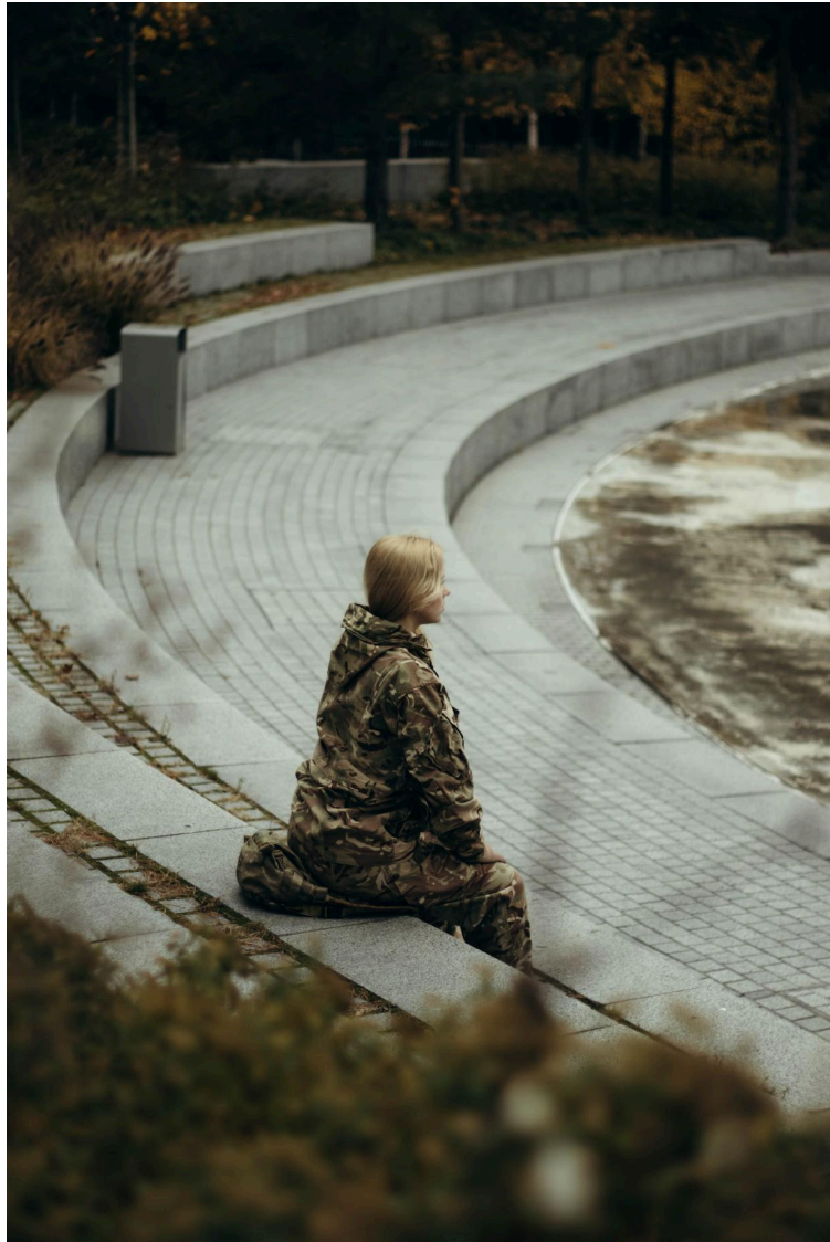
Фото 12. Робота з природним світлом або підлаштування під погодні умови.