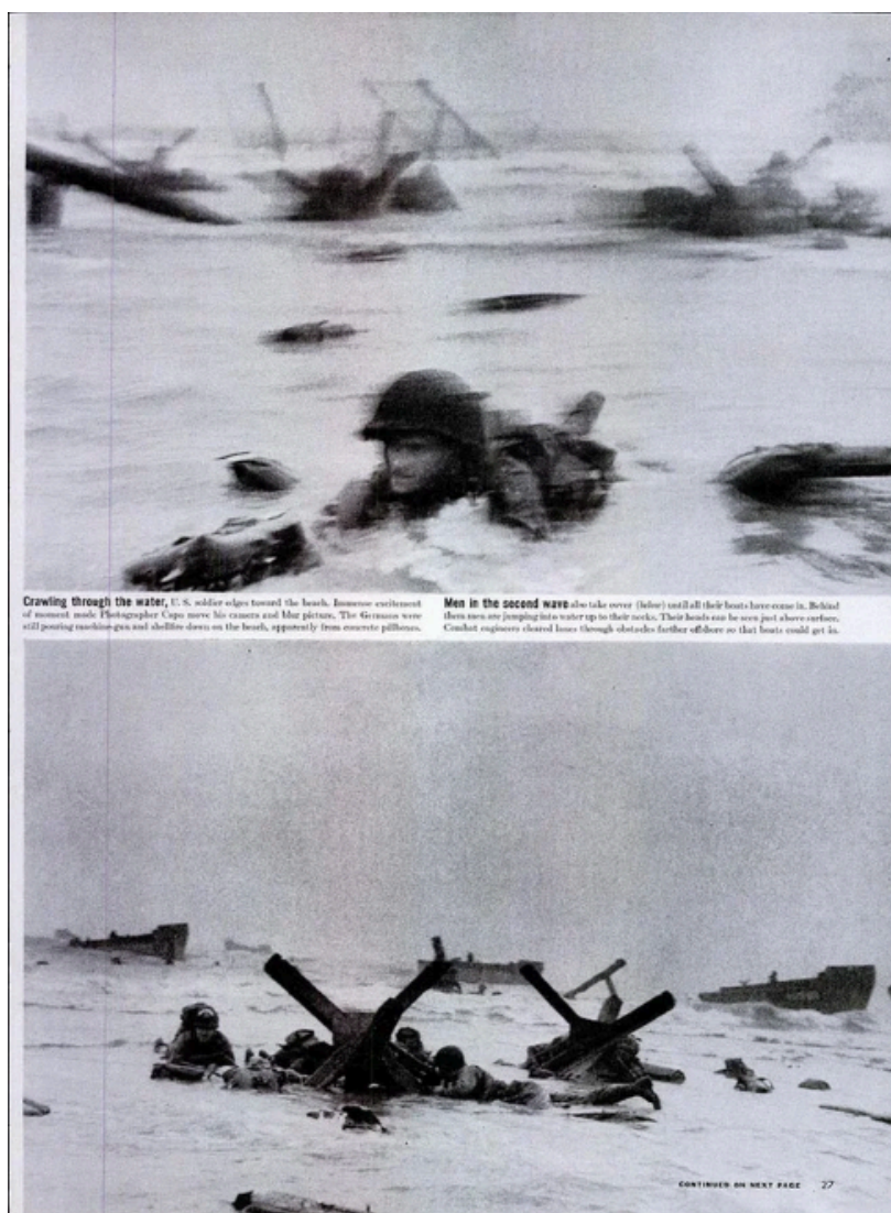
Рис. 2.3 Приклад 2. Репортаж з пляжу Омаха для журналу LIFE зі світлинами Роберта Капи від 19 червня 1944 року [11]

Сайт «Локальна історія» зазначає, що через понад 60 років виявилось, що Капа висадився в секторі, де спротив німців майже подолали [11]. Він фотографував саперний підрозділ, який розчищав німецькі загородження, а зображені "танки" виявилися інженерною технікою. Крім того, доказів про зіпсовані плівки знайти так і не вдалося, що поставило під сумнів частину легенди про той знаменитий репортаж.