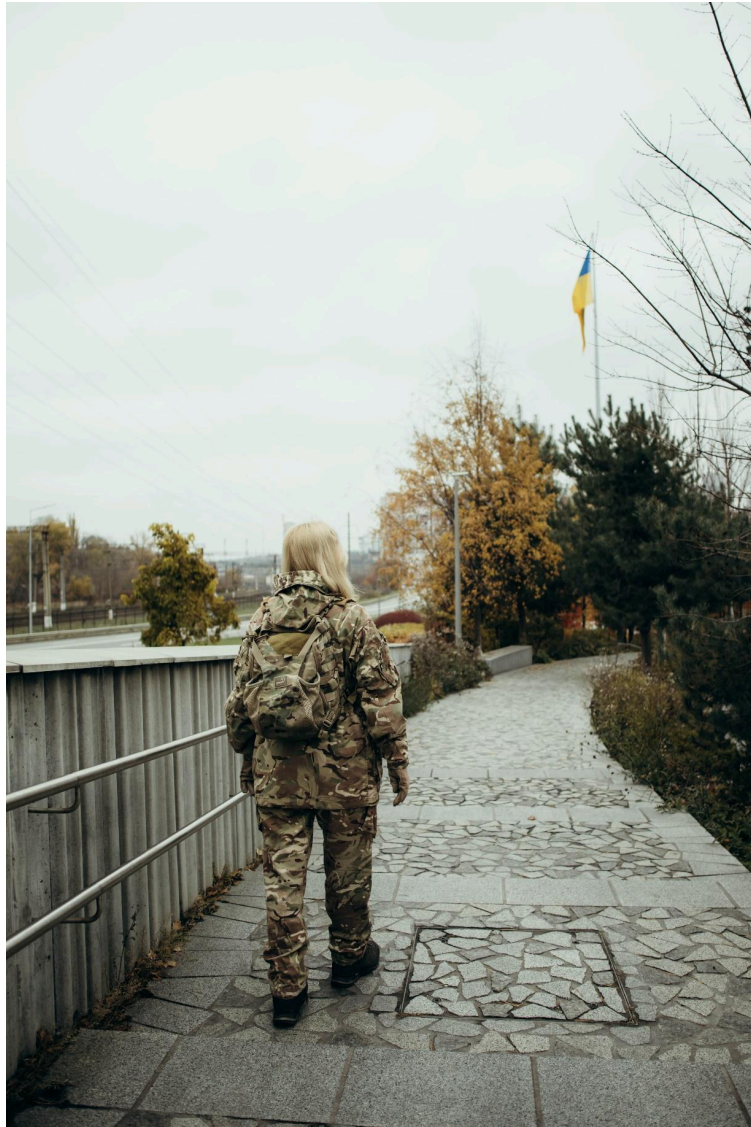
Фото 11. Локація відображає настрій.