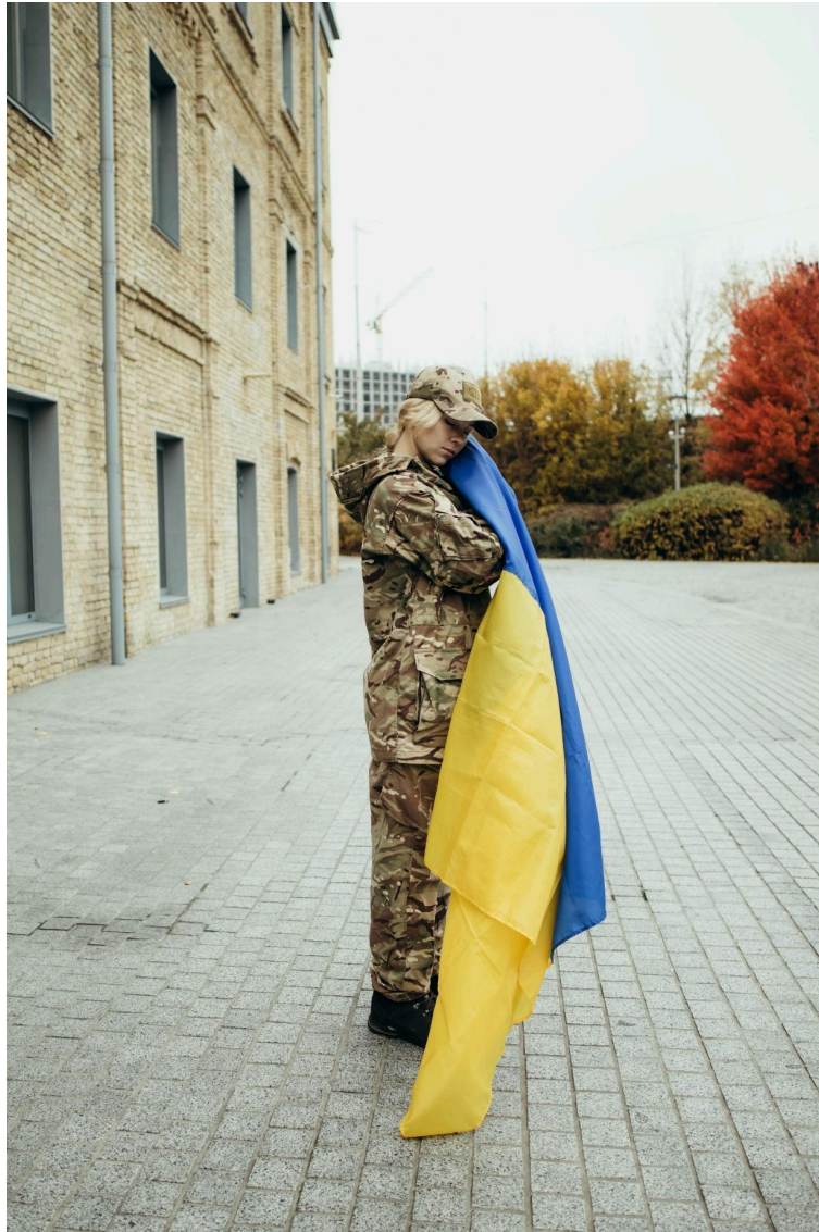
Фото 14. Взаємодія з прапором України.