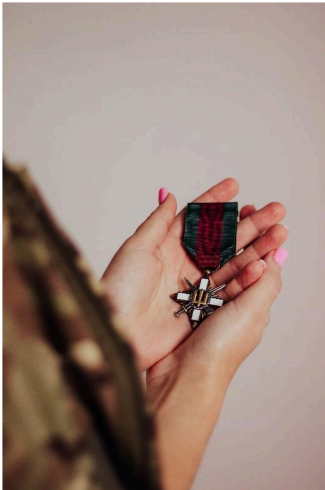
Фото 6. Приклад Хай-кей світла.