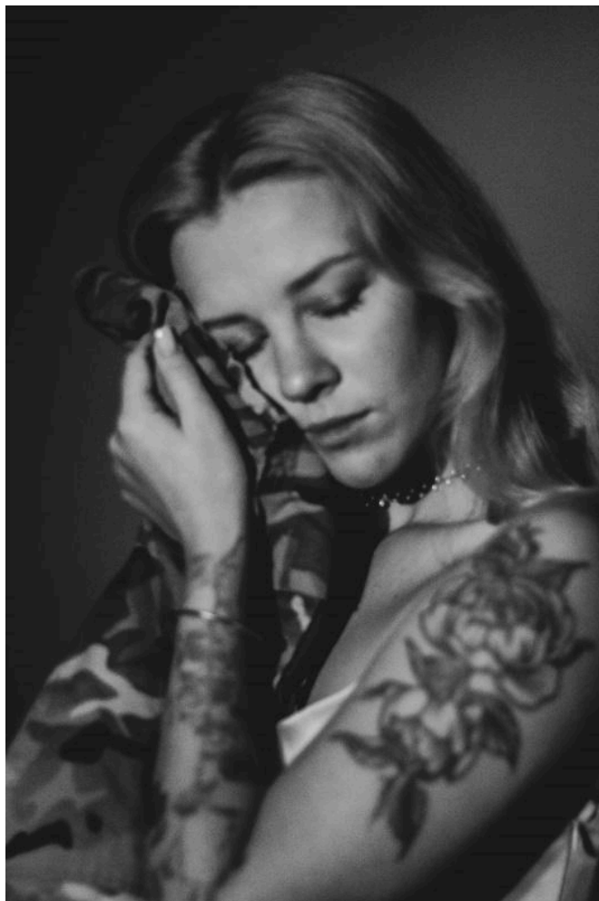
Фото 2. Приклад роботи з рефлектором. Автор Софія Пономаренко