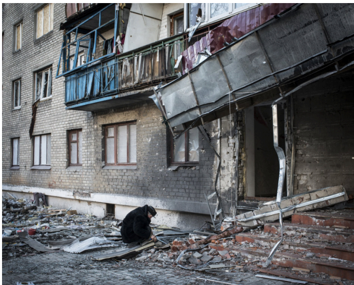
Фото 5. Українська криза 2 від Гійом Ербо