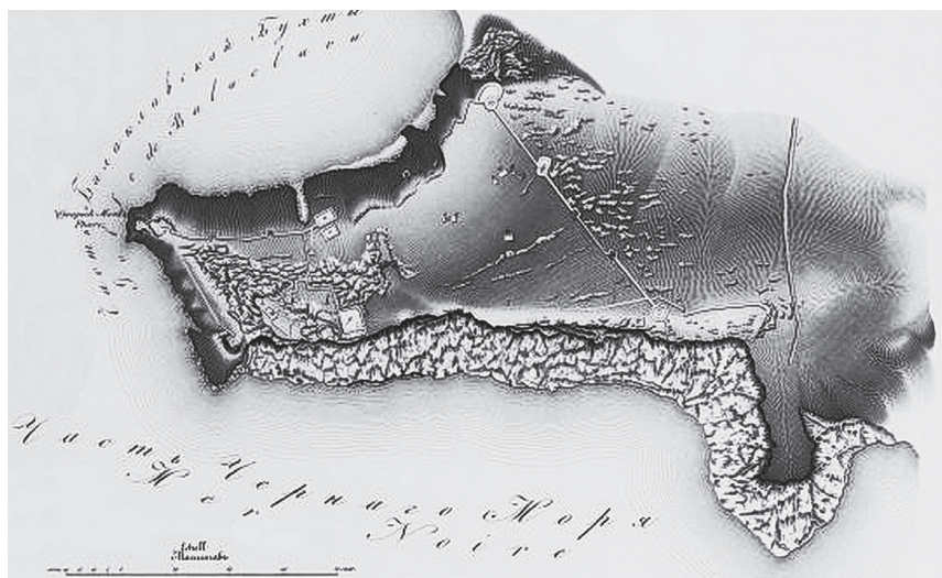
Рис. 2. План крепости Чембало в середине XIX в. [см. 9, табл. LXXXIX]