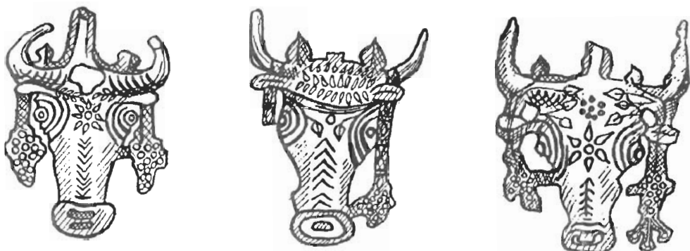
Рис. 2 Свищовые букрании (Ольвия) - IV - II вв. до н. э.

Возлияния и воскурения часто соединялись с другими обрядами, в частности с принесением в жертву животных. Сведения о проведении кровавых жертвоприношений в Северном Причерноморье содержат сакральные законы Ольвии III в. до н. э. и Фанагории II в. н. э. Об этом свидетельствуют костные остатки жертвенных животных [19, с. 145], а также букрании — стилизованные изображения головы жертвы. Предназначенное для жертвоприношения животное обычно украшали повязками и венками [1, с. 88]. Свищовые букрании IV — II вв. до н. э. в виде головы быка, украшенные повязками, розетками, листьями плюща, гроздьями винограда (рис. 2) [25, с. 84-106] и их изображения на монетах V — IV вв. до н. э. засвидетельствованы в Ольвии [26, с. 301-305]. На херсонесских алтарях IV — III вв. до н. э. встречаются изображения букраниев в виде голов козла, быка, барана [12, № 125; 27, с. 19].