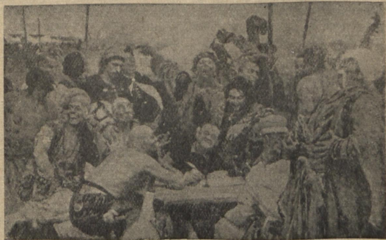
На фото: репродукція з картини І. Ю. Рєпіна «Запорожці пишуть листа турецькому султанові», експонованої в Харківському музеї образотворчого мистецтва.

Виключним успіхом користувалась відкрита в березні 1955 р. виставка творів радянських художників з зібрання Третьяковської галереї. Понад 65 тисяч харків'ян відвідали в квітні цього року виставку польського образотворчого мистецтва.