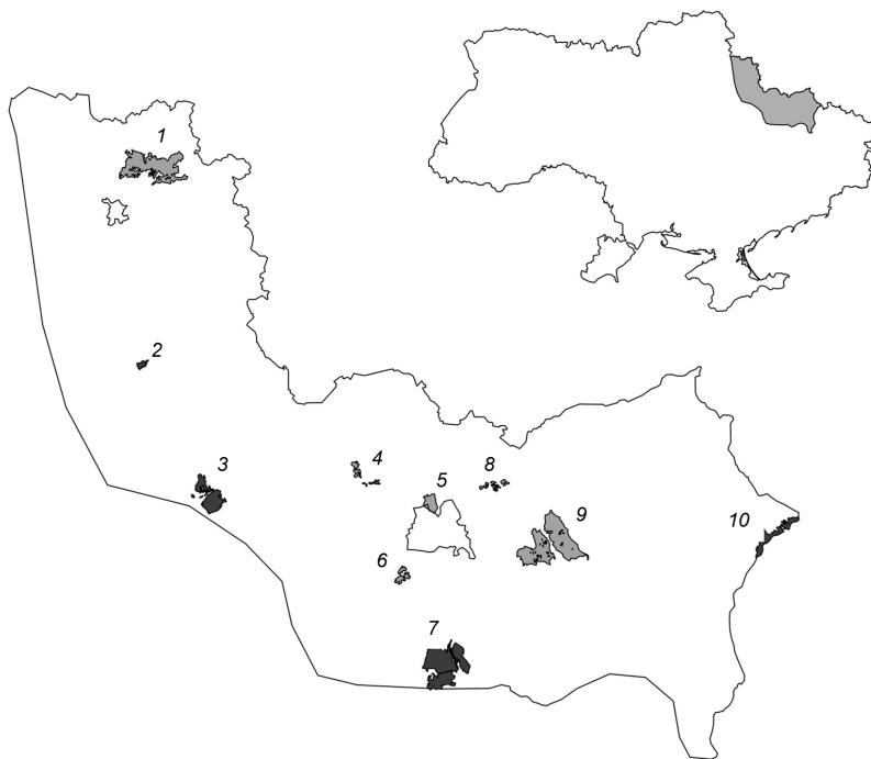
Рис. 1. Харківський Лісостеп із місцями збору матеріалу.

Лісові території, на яких здійснювався збір матеріалу: 1 – Могрицька лісова дача; 2 – парк-пам'ятка садово-паркового мистецтва „Тростянецький”; 3 – національний природний парк (НПП) „Слобожанський”; 4 – ліси в окол. с. Мала Рогозянка; 5 – Харківський Лісопарк; 6 – ліси в окол. с. Яківлівка; 7 – НПП „Гомільшанські ліси”; 8 – проєктований регіональний ландшафтний парк „Петрівські балки”; 9 – Печенізько-Тетлежанська лісова дача; 10 – НПП „Дворічанський”