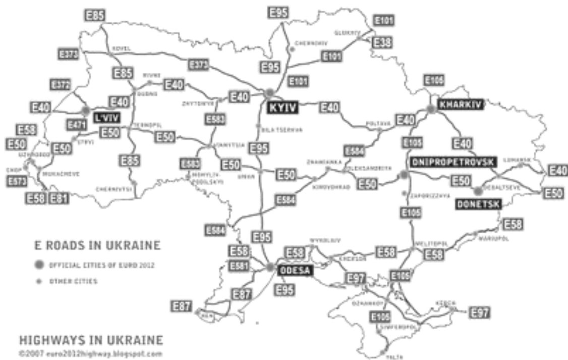
Рис. 3.1. Карта автошляхів України

a – лінійний; б – кільцевий; в – радіальний; г – комбінований