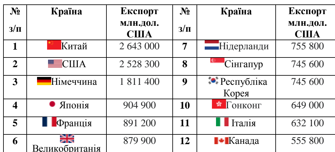
Таблиця 1 - Динаміка найбільших експортерів світу у 2022 році [2].

На карті світу проведено візуалізацію на рис. 1 у кольоровому відображенні від темного до світлого залежно від обсягу експорту товарів та послуг.