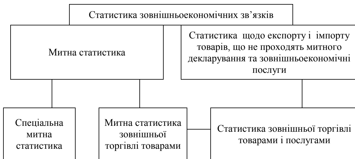
Рисунок 1.1 - Місце митної статистики у системі підгалузей статистичної науки [4]

Митна статистика, як складова статистики зовнішньоекономічних зв'язків, враховує товари, що переміщуються через митний кордон, а також веде облік торговельних партнерів України, суб'єктів підприємницької діяльності, облік валют, контрактів та інше [1]. Крім того митниці ведуть облік та аналітику у спеціальних галузях власної діяльності, таких як виявлення випадків контрабанди та порушень митних правил, неторговим оборотом тощо. Тому митна статистика поділяється на митну статистику зовнішньої торгівлі товарами та спеціальну митну статистику (рис. 1.1).