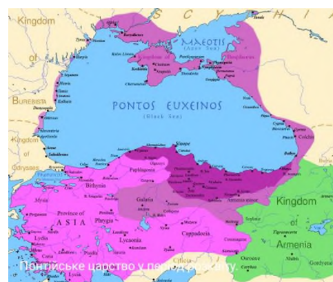
Понти́ське царство у першій половині I ст. до н. е.