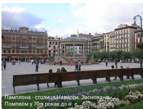
Памплона - столиця Наварри. Заснована Помпеем у 70-х роках до н. е.