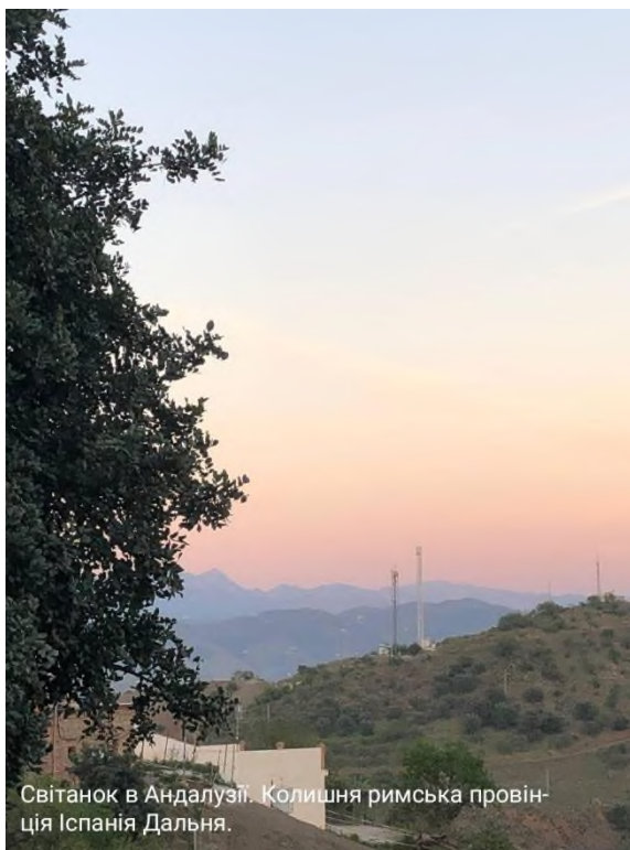
Світанок в Андалузії. Колишня римська провінція Іспанія Дальня.