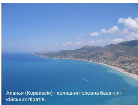
Аланья (Коракесія) - колишня головна база кілікійських піратів.