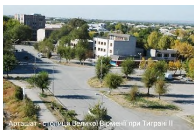
Арташат - столиця Великої Вірменії при Тиграні II