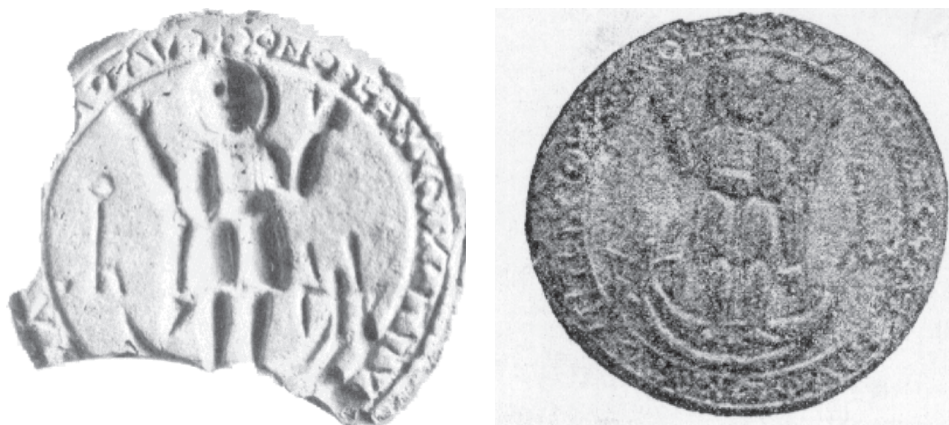
Рис. 1. Форма для оттиска евлогия с изображением святого Фоки (штамп и оттиск) (Херсон)