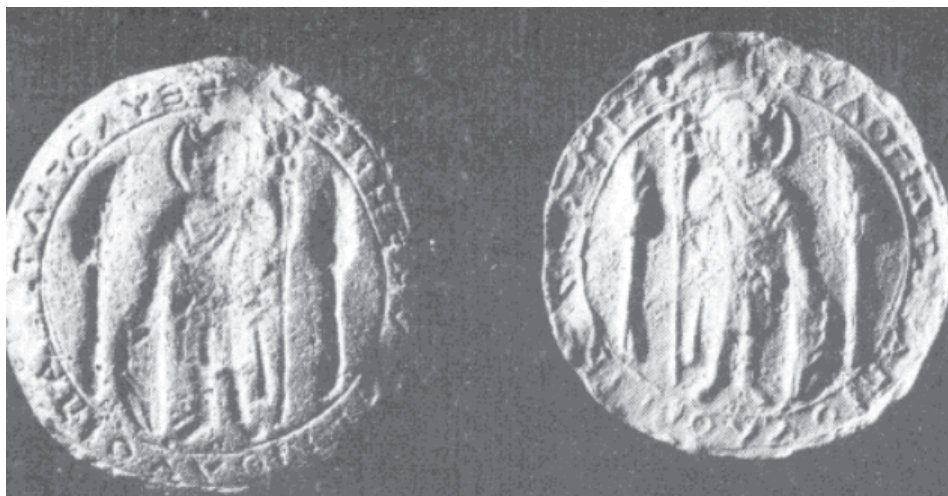
Рис. 3. Форма для оттиска евлогия “Благословение Св. Лу[п]а” (Херсон)