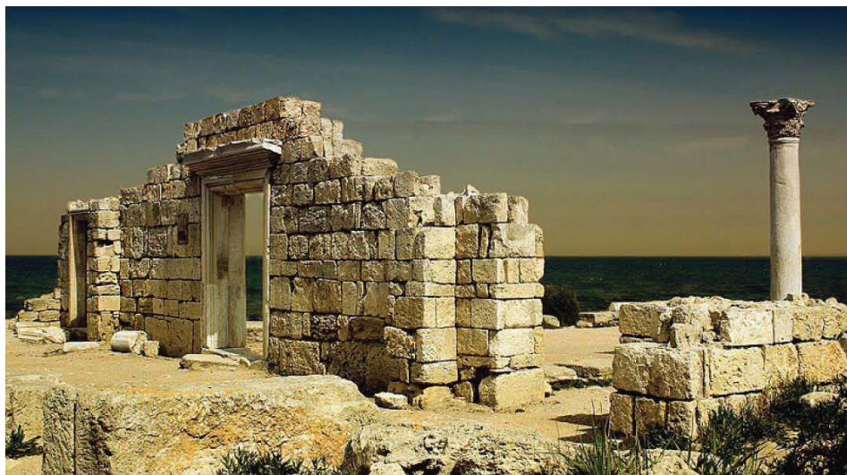
Базилика 1935 года. Херсонес Таврический