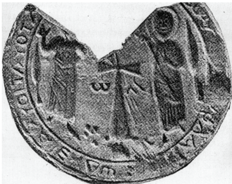
Рис. 2. Форма для оттиска евлогия Св. Феодора с изображением креста с буквами и предстоящими святыми (Херсон)