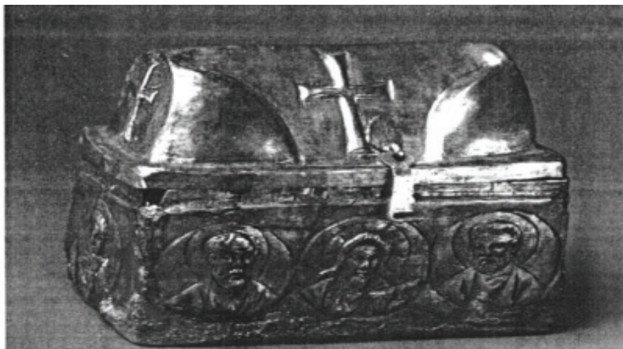
Рис. 5. Ларец для мощей из храма № 19