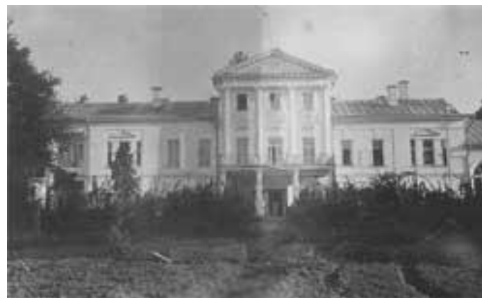
Бывшее имение Морозова, где находился детский дом