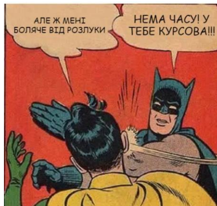
Рис 3.7 – Мем про розставання, як відчуття, які може переживати студент

Меми про розрив часто відтворюють складні емоції, які переживають студенти під час розставання. Наприклад, у мемі "Коли ти намагаєшся сказати своєму партнеру, що ти не хочеш більше зустрічатися, але не хочеш його образити", насмішливо підкреслюється внутрішній конфлікт і незручність, які виникають, коли студенти намагаються завершити відносини.