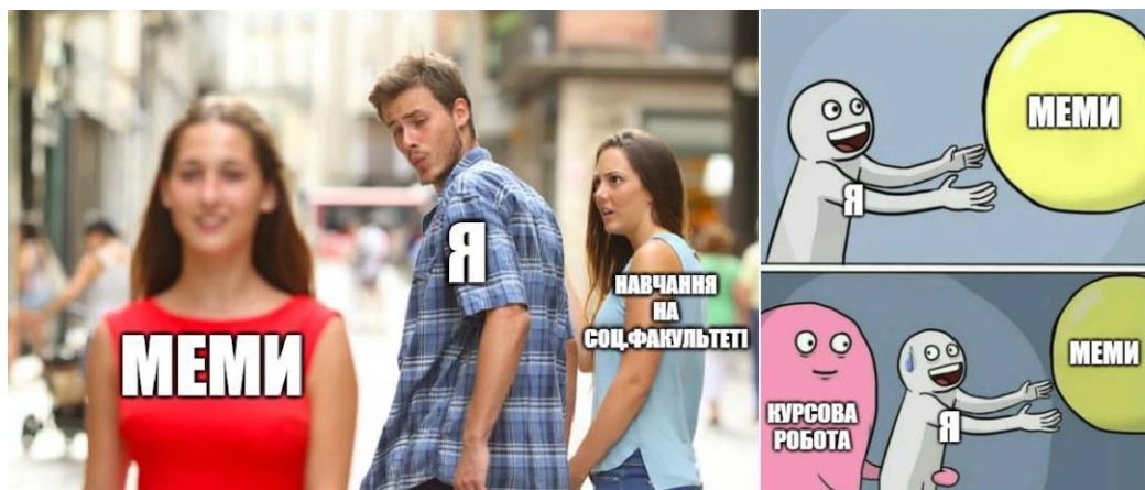
Рис 3.8 – Мемі про захоплення студентів

Мемі про захоплення певною темою часто використовують самоіронію, щоб продемонструвати, наскільки студенти можуть бути поглиблені у своїй пристрасті. Наприклад, у мемі "Я, коли вивчаю [назву теми]", іронічно підкреслюється те, як студенти можуть занурюватися у свої дослідження та ставати вкрай захопленими своєю темою.