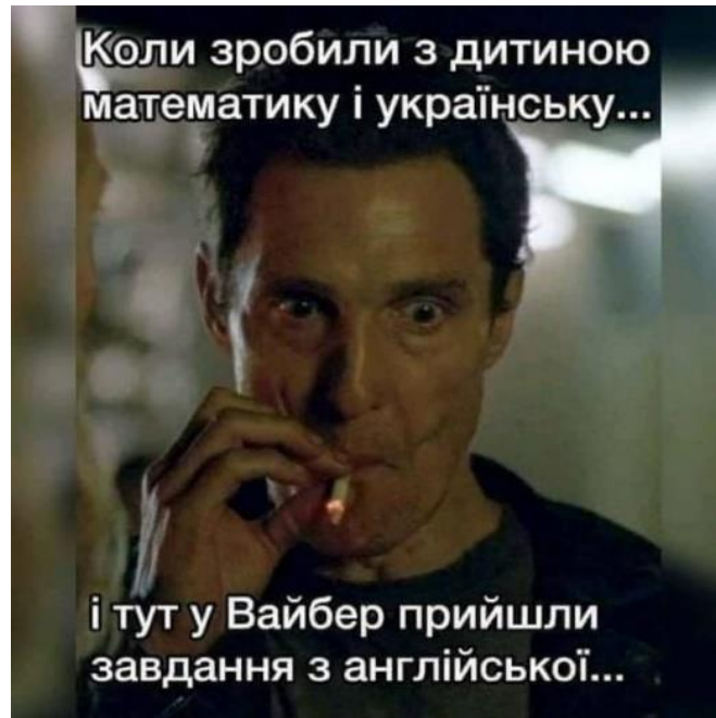
Рис. 3.6 –Мем про стрес від навчання