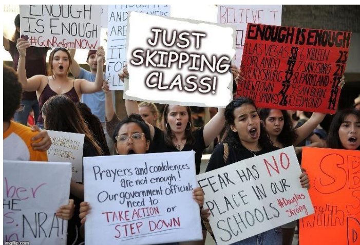
Рис. 3.5 – Мем, який спонукає до дії

бере участь у протесті, може бути використаний для критики певної політики або практики. Цей мем може допомогти підвищити обізнаність про це питання та заохочити людей до дії.