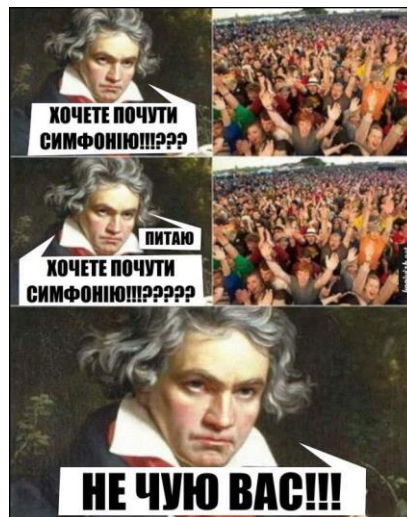
Рис.3.3 – Мем про Людвіга ван Бетховена

Також, меми можуть служити засобом об'єднання студентів навколо спільних зацікавлень. Наприклад, меми про конкретний вид спорту, музику або політичну орієнтацію можуть допомогти студентам знайти однодумців. Це особливо важливо для тих, хто відчуває себе відокремленими або ізольованими серед інших студентів. Наприклад, студент, зацікавлений у музиці або мистецтві, може знайти меми, пов'язані з цими темами, на соціальних мережах або в Інтернеті. Ці меми можуть сприяти його знайомству з іншими студентами, які також поділяють ці інтереси або мають схожі уподобання.