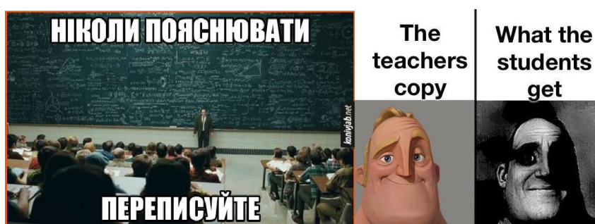
Рис. 3.4 – Меми, які сатирично відображають викладання з боку викладачів

Один із методів, яким меми можуть служити для критики в студентській субкультурі, полягає у їх здатності до сатири (рисунок 3.4). Меми часто використовують гіперболу, гру слів та інші сатиричні засоби для висміювання або критики певної ідеї чи практики.