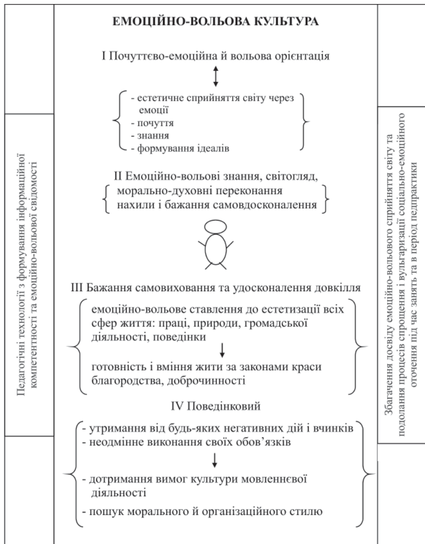
Схема 1. Модель процесу формування емоційно-вольової культури студентів класичних університетів