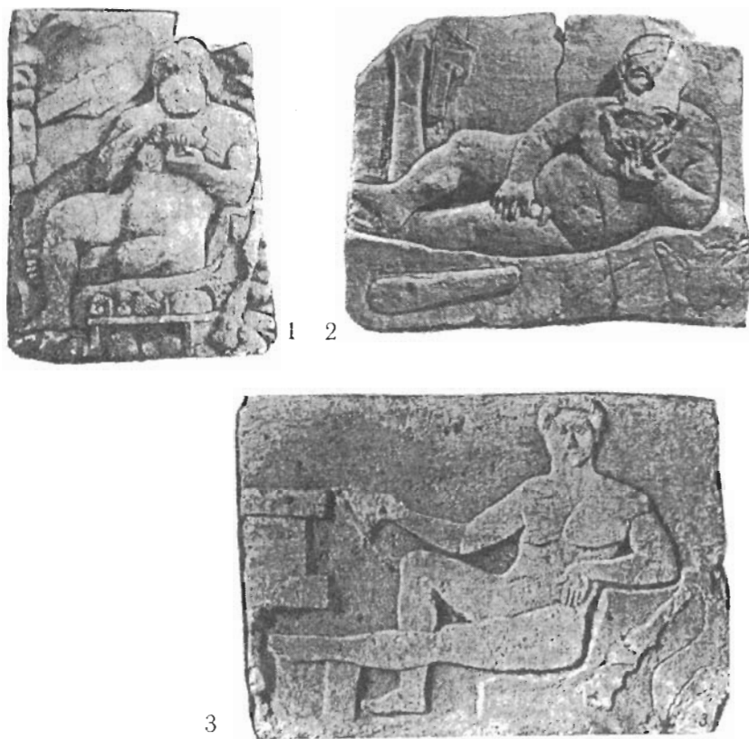
Рис. 3. Рельефы с изображением Геракла из находок в Северо-Западном Крыму: 1 – Саки, 2 – поселение Чайка, 3 – Мойнаки.

с богами-целителями типа Асклепия, а находки рельефов с изображением Геракла в Саках и Мойнаках, районах целебных озер и источников, по мнению автора, делают это предположение еще более вероятным.