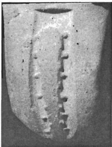
Рис. 1. Клеймо с палицей Геракла на ручке херсонесской амфоры из раскопок поселения Маслины

Клеймо с палицей Геракла представлено на Маслинах единственным экземпляром, и думается, этот вид клеймения вообще не был типичен для керамической эпиграфики Херсонеса; по крайней мере среди известных публикаций херсонесских клейм ему не удалось