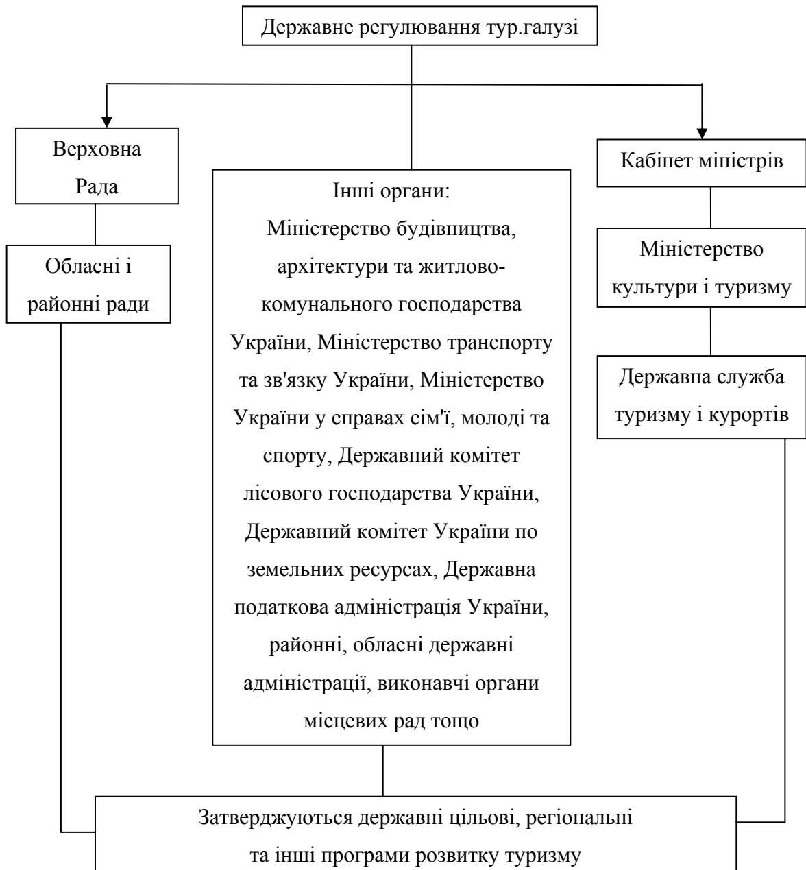
Рис.1.2. Графічна схема державного регулювання туристичної галузі України.