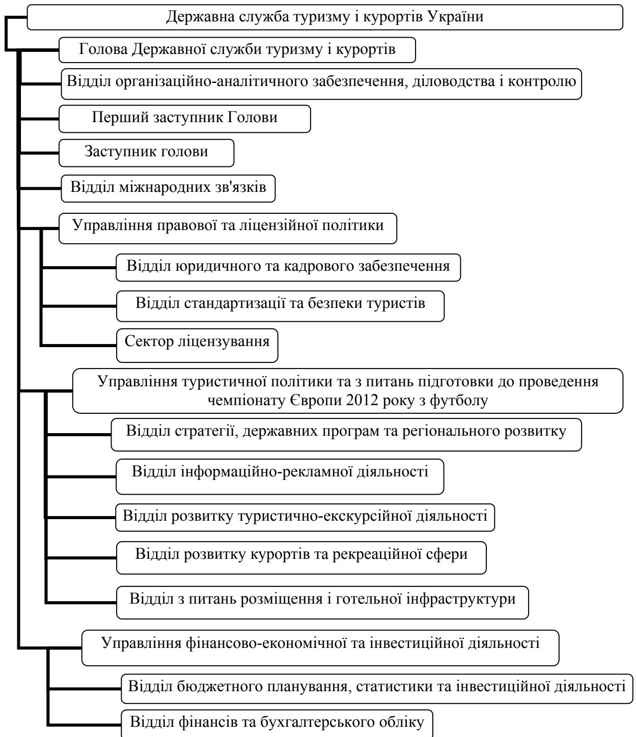
Рис. 1.4. Схема організаційної структури Державної служби туризму та курортів України