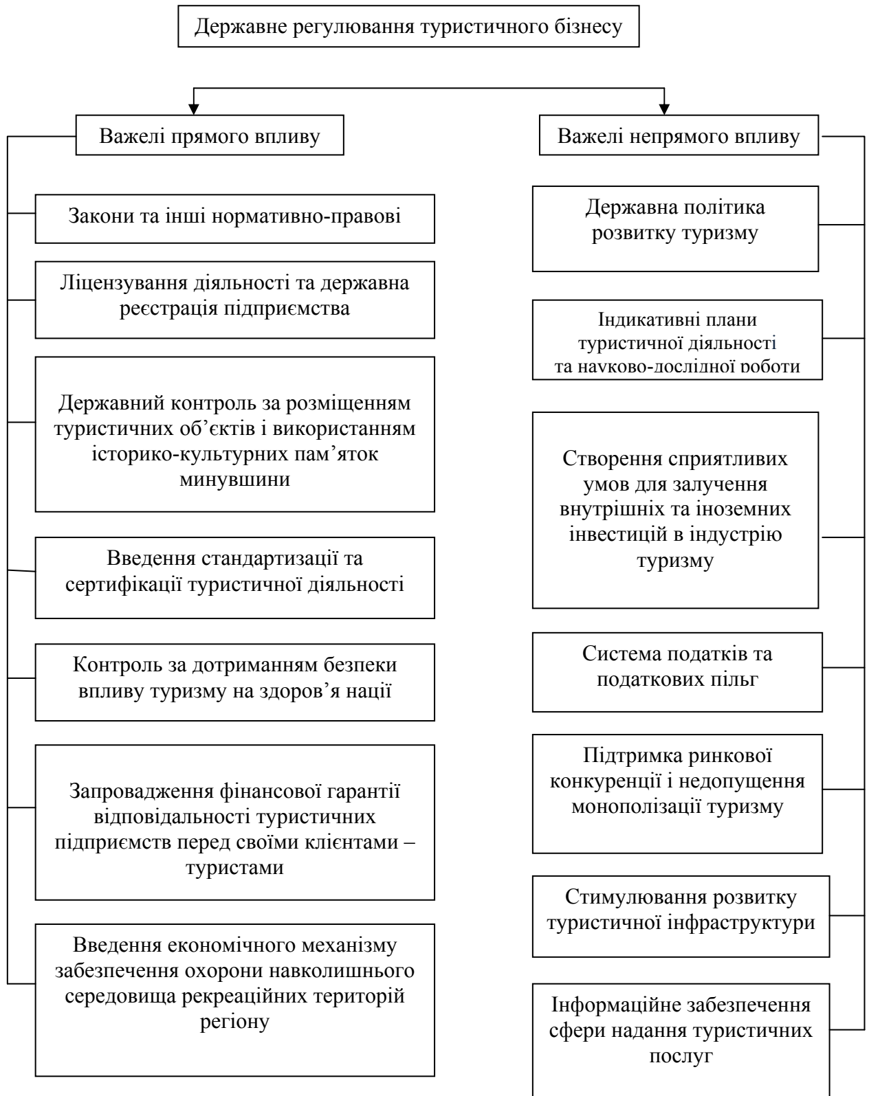
Рис.1.1. Важелі державного регулювання туристичного бізнесу в Україні