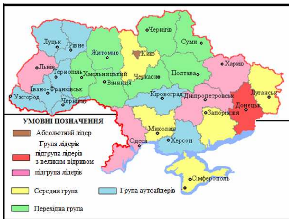
Рис. 2. Групи регіонів України за сукупністю доходів та витрат населення за 2010-2011 рр. (побудовано за даними [1-27])

Абсолютний лідер (за вибіркою) – місто Київ – лідер за всіма абсолютними та відносними показниками. Рівень життя в Києві значно відрізняється від решти регіонів. В Києві набагато вищі за середні заробітні плати (3400 грн.) та пенсії (1500 грн.). Високою є концентрація підприємств – 250 на 10 тис. населення та кількість зайнятих на підприємствах працівників – 400 тис. осіб; фонд оплати праці становить понад 8500 млн. грн. Для цієї групи характерним є те, що частка осіб з доходами менше прожиткового мінімуму є найнижчою в Україні і становить 7 %, проте найвищими є сукупні витрати домогосподарств (4400 грн.).