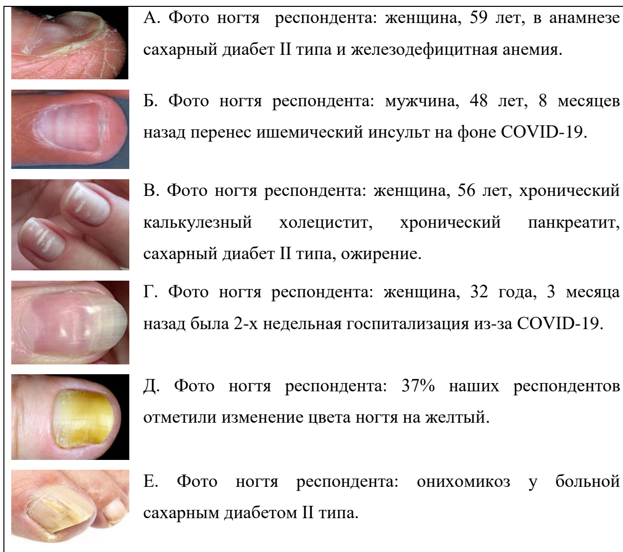
Рис. 1. Фото измененных ногтей наших анонимных респондентов

ногтей, а у больных с нейропатической формой одновременно поражены ногти и кожа стоп.