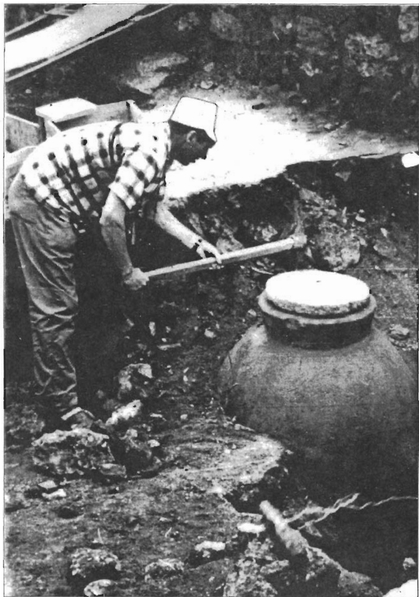
В раскопе (Херсонес Таврический, 1966)